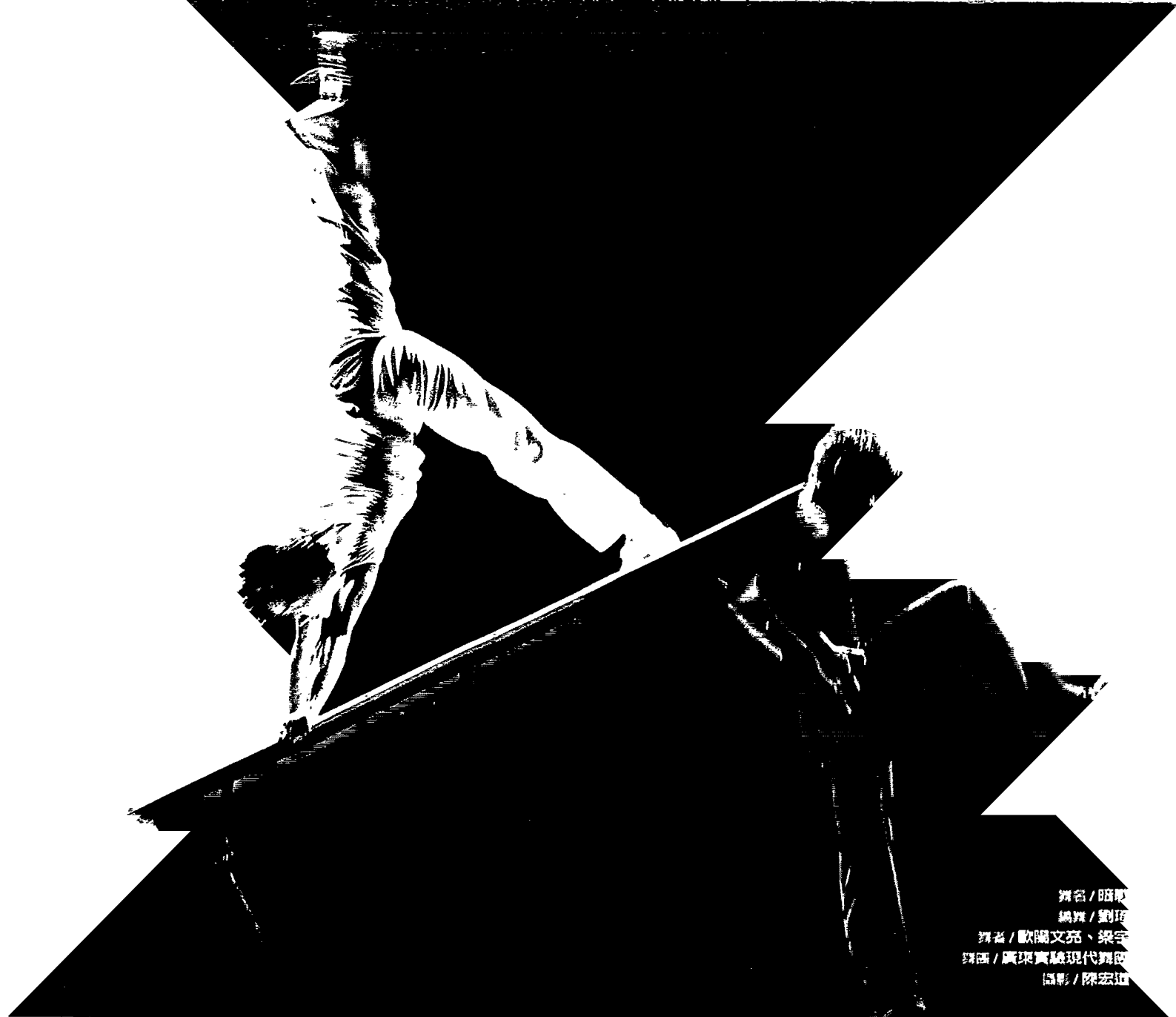
舞名 / 暗戰 編舞 / 劉珩 舞者 / 歐陽文亮、樂宇 舞團 / 廣東實驗現代舞團 攝影 / 陳宏道

上演時，卻突然傾盆大雨，氣溫急降，所謂「雲南之雨，一夜成冬」就這樣發生了。該團首演之夜安排在室外的世博園劇場，引來了將近三百多人，幾乎滿場的觀眾，而且不同於前述的藝術劇場，觀眾在每首舞之後，熱烈鼓掌，當地報紙隔天報導：「台上美麗『凍』人，台下熱氣騰騰，場外冷風颼颼，大雨不止……」。