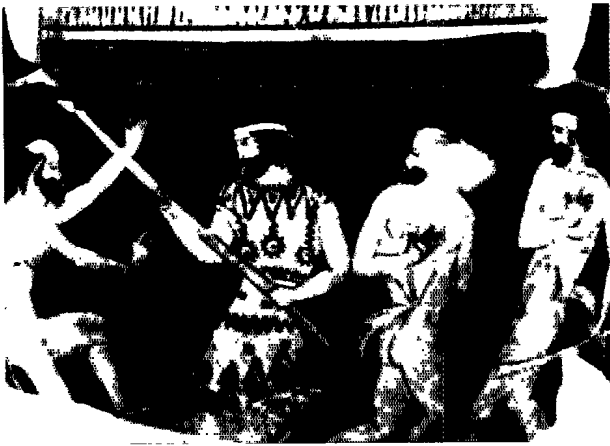
圖2 普羅米修斯盜火，前420年陶器畫，雅典國立考古美術館藏。 （圖片來自《萬物百科·世界文學》—雜誌與圖刊2000/7期，頁20。）