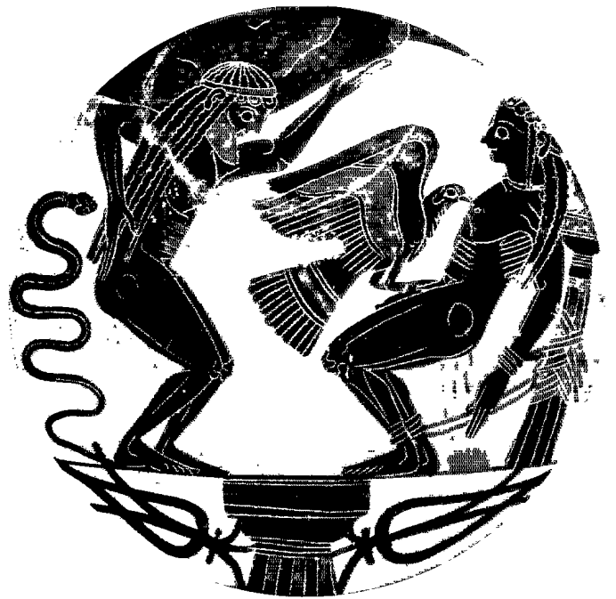
圖4 折磨的普羅米修斯和阿特拉斯，約550年至500年陶器畫，直徑約26公分，梵蒂岡博物館藏。引自《新加坡大百科，世界文壇51—神話與寓言(2000.7.9)》，頁20。

需求的滿足，也象徵著人類智慧的開啓。宙斯發現此事時，甚為憤怒，不願念當年普羅米修斯為徧祖他而與同族泰坦族人（Titan）抵抗，協助宙斯顛覆其父克洛諾斯（Cronos），取得王權成為諸神領袖的情義。只為了小小的火苗，宙斯竟以仇報恩，指示鐵匠神赫淮斯托斯（Hephaestus）將普羅米修斯用釘、鏈的方式，縛綁於高加索山的一塊岩石上，那裡有一隻巨鷹經常出沒，每日出現啄食普羅米修斯的肝臟，一到傍晚巨鷹飛走，他的肝臟又恢復原狀，這永無止境的折磨，壓倒他違背宙斯的禁令。