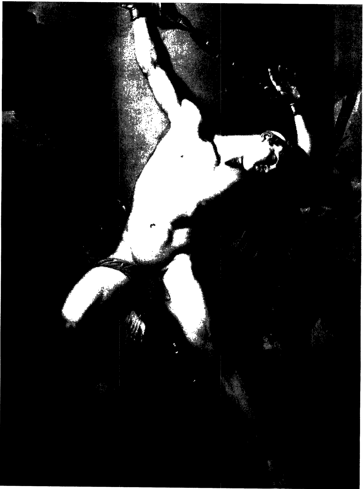
圖5 特亞·密爾的普羅米修斯，油畫，創作年代與尺寸不詳，法國Crozatier藏 ·引自 張心龍(2000:91)。希臘羅馬神話與傳說－神話·繪畫，頁101。台北市：雄獅圖書。