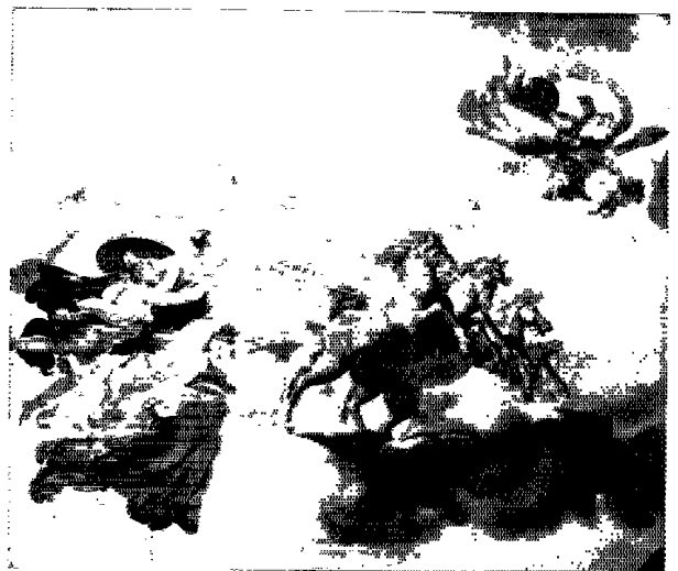
圖1 義大利佛羅倫斯普蒂宮天花板彩飾—普羅米修斯。 ·圖片來源：藝文網發行，牛津英漢百科大辭典(1985)，頁1475。 ·台北市立資料文化事業。

在義大利的佛羅倫斯，一座堪稱文藝復興時期最具雄偉的宮殿普蒂宮（Pitti），由商人路加·普蒂（Luca Pitti）於一四五七年斥資，布魯內列斯基（Brunelleschi）規劃，所設計出峇華美麗的宮殿建築。宮殿內除了有絢爛的天花板彩飾外，還擁有豐富藝術珍藏的博物館如：帕拉提那（Palatina）畫廊和亞珍提（Argenti）畫廊，後者的濕壁畫尤其生動活潑，格外引人觀駐。其中一件天花板的裝飾，描繪光澤透明的蒼鷺，阿波羅佇立馬車上，踩著雲彩奔行。九位文藝復興身披彩帶飄逸隨行，而滿臉落腮、黑髮鬍鬚的普羅米修斯（圖1）就從阿波羅的御車轉動間點燃火苗，在一身武裝的正義女神雅典娜（Athena）的隨護下，運送盜取的火種給予大地子民。