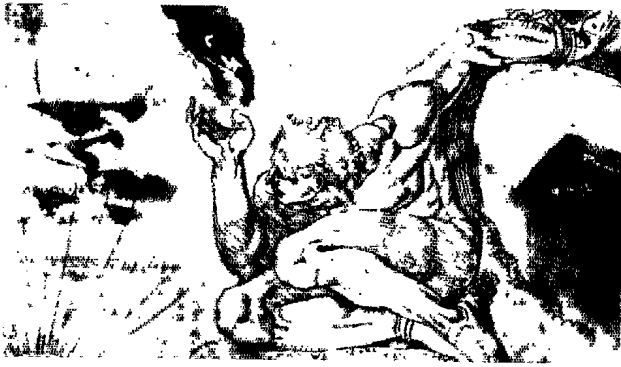
圖5 由阿巴多（Abbado）帶領柏林愛樂樂團演出神話喜劇「普羅米修斯」，是拜貝格、莫斯特、史克里亞賓和諾諾、呂基等作曲家所詮釋心目中的「英雄」。(B封面是威靈頓製作的「被綁綁的普羅米修斯」，描繪日出時，英雄面對巨鷹傳襲的場景。此件作品的人體部分，可見這位不知名藝術家受米開朗喬雕塑型上的影響。)

宙斯一個秘密，因為當時宙斯喜歡美髮女神特蒂絲（Thetis），但普羅米修斯透露一個謠言說特蒂絲帶的小孩，長大成人後，其力量會勝過乃父，所以宙斯深怕重蹈自己的覆轍，猶豫萬分，最後只好無奈放棄（交關拙劣；至蘋果之爭—帕里斯的審判，又有另一說明）。頭言中的小孩即是後來希臘聯軍的勇士阿奇里士（Achilles）。宙斯之後指示赫克里斯（Heracles）解開普羅米修斯的鐵鏈。另有一說是半人半獸的奇降，擁有不羸之身，他願意代替普羅米修斯受刑，經宙斯同意，而解放了普羅米修斯。