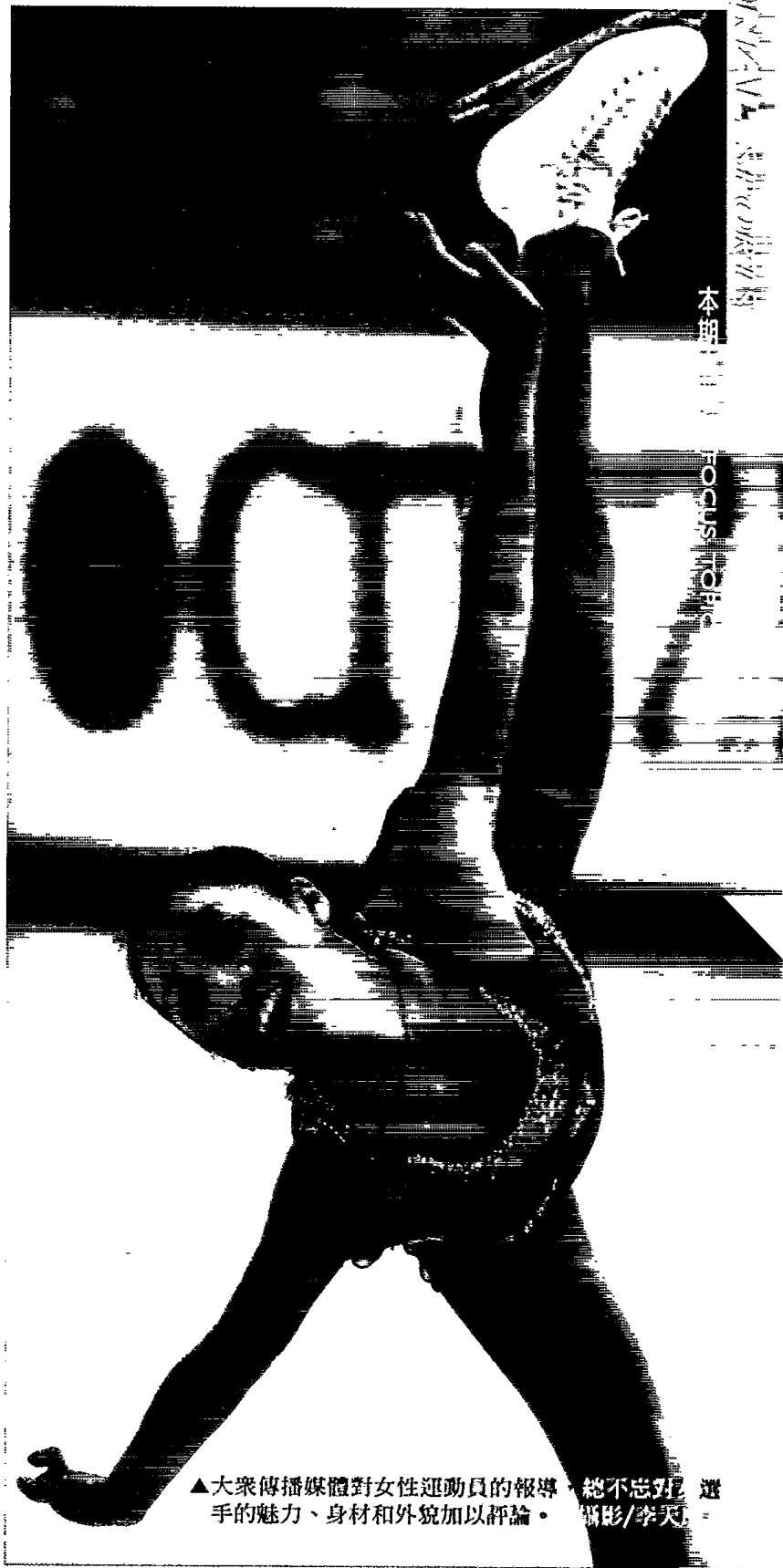
▲大眾傳播媒體對女性運動員的報導，總不忘對選手的魅力、身材和外貌加以評論。

一直以來而國際奧會委員都是男性獨占的局面，女性欲踏入管理階層何等容易。呂聖榮與孫葆麗（2000）提到，儘管在60、70年代女子競技運動快速發展，但委員都是男性，直到1981年第84屆國際奧會年會上，芬蘭的Pirjo Haggman和委內