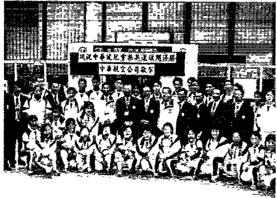
▲經過女權意識抬頭，女性參與競技漸被接受也趨於平等。

月國際奧會中有14名女委員比例已達12.4%，表示出女性地位已經在提昇中和能力表現方面更是受到肯定的(郭雲鵬，2001)