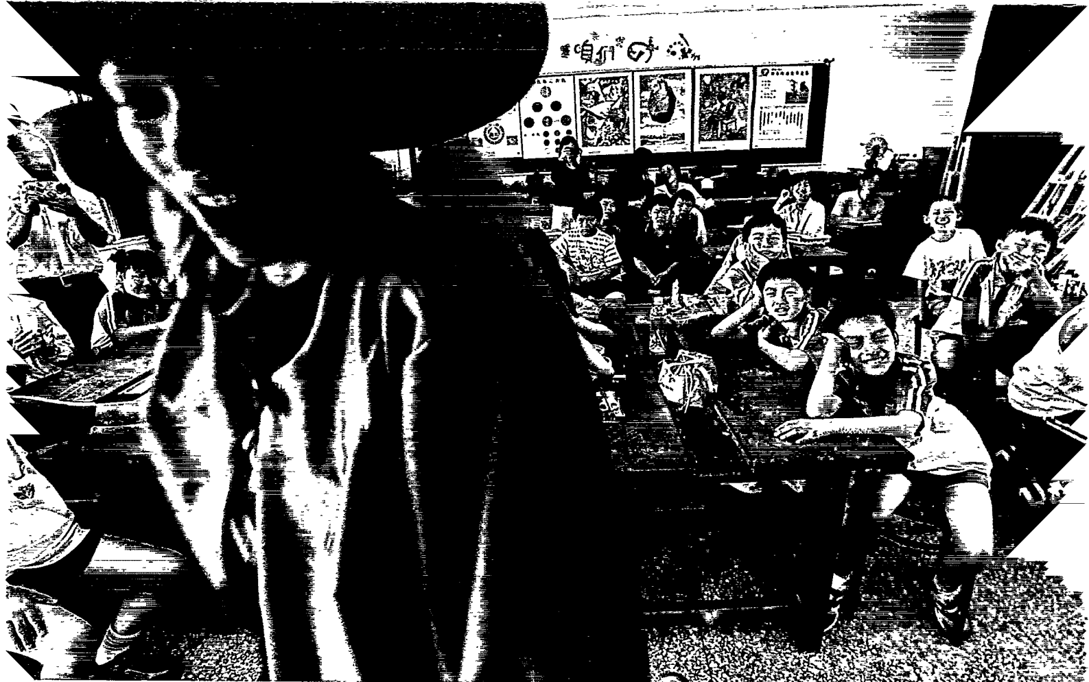
觀眾的反應往往成為一場表演成功與否的重要指標之一。

這本由五南出版社出版的《舞蹈欣賞》，以培養讀者對舞蹈的欣賞能力為出發點，告訴讀者如何感受每一種舞蹈之美。