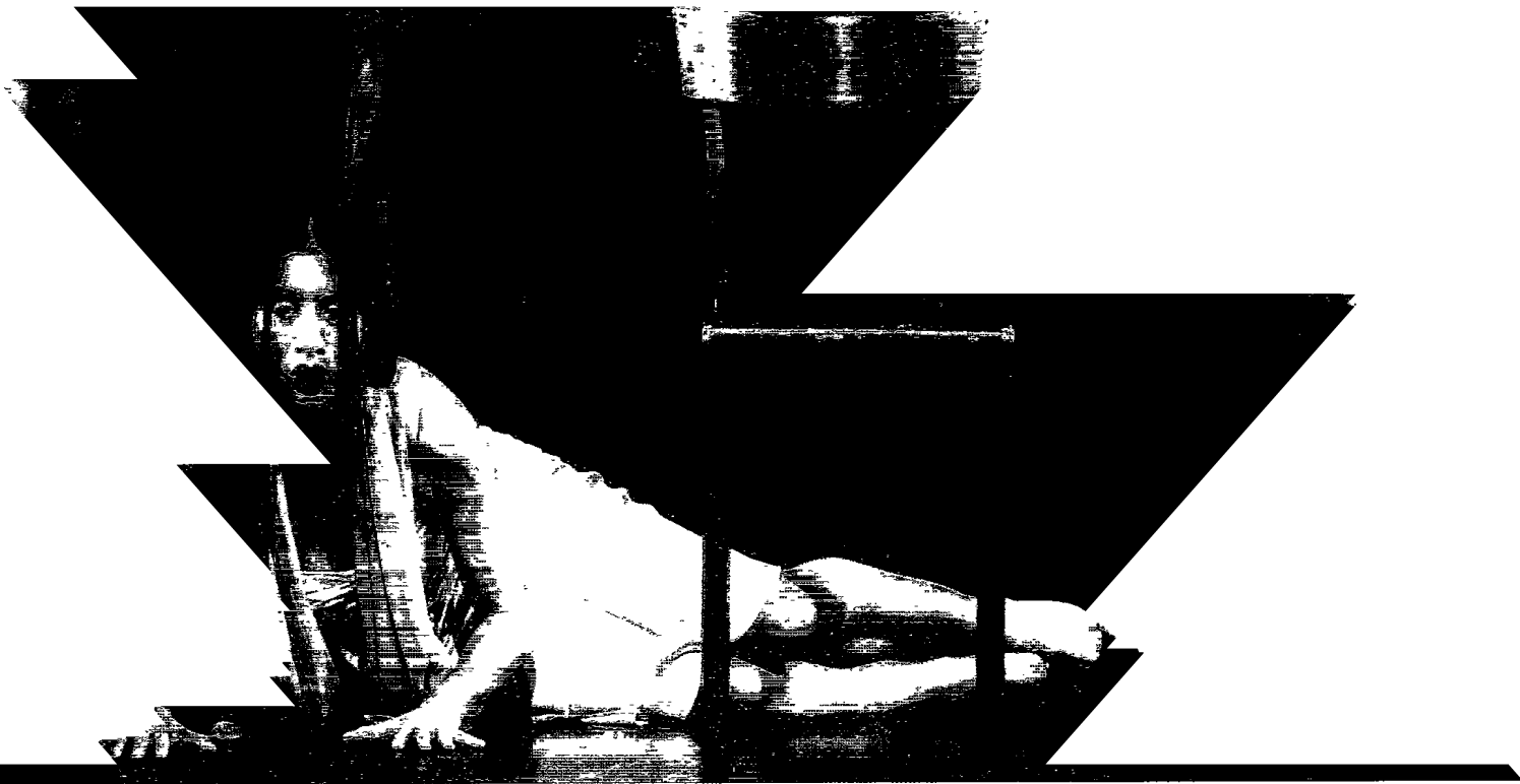
表演藝術是各種藝術之綜合，在閱讀時放開胸懷感受，不需刻意區分藝術形式。