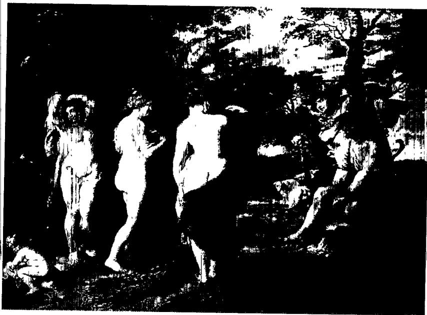
魯本斯 帕里斯的審判 油畫 木板 1632—1635 145X194cm 倫敦國家畫廊

位，而釀成的神話歷史的悲劇；又創世紀裏的亞當與夏娃，在安逸的環境裡仍禁不住誘惑及慾望的作弄，而偷吃「禁果」，破壞與神的承諾，帶著懊悔被逐出伊甸園，從此必須面對接受種種苦境。此外，還有一顆家喻戶曉的「蘋果」，那就是德國民間「格林童話」中的「白雪公主」，格林兄弟倆人蒐集和研究德國語言的根源和故事，於一八一二年編寫出這篇著名故事。