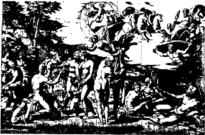
雷蒙狄 帕里斯的審判 版畫 1514-18 29.2x43.3cm 大英博物館藏

決選之時，先與這位英俊的評審人謀面，一來爭得好感，二來私下許諾，再者阿諛奉承，盼能順利當選。於是，希拉要讓帕里斯腰纏萬貫；雅典娜應允聲望名譽；而阿佛柔黛蒂則施出美人計，允諾介紹天下最美麗的女人許配與他。三位女神私下向帕里斯表態和承諾，以謀求最後的殊榮，也為往後的人世間，於每項競賽裡，種下「買票賄選」敗壞世風的惡習。