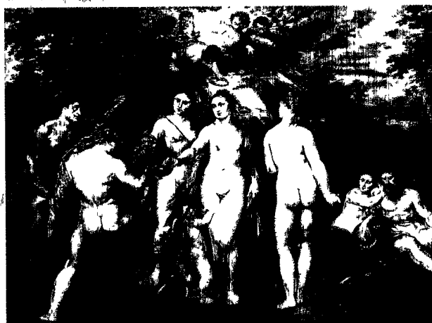
魯本斯 帕里斯的審判 油畫 1600 133 9X174 5cm 倫敦國家畫廊藏

的金蘋果，讓眾神們一時發楞，不解其意。艾莉斯竊笑著眾神們對這顆金蘋果疑惑之際，昭告宣稱，這顆金蘋果是歸屬於最美麗的女神，有了它無疑就是代表美麗的化身。