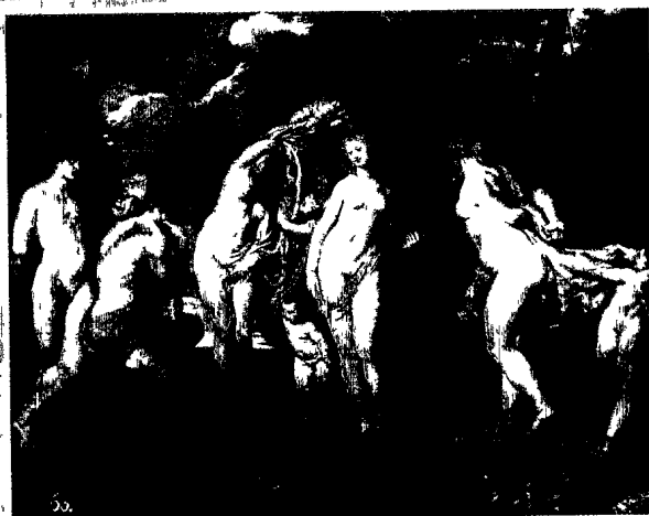
魯本斯 帕里斯的審判 油畫 1602 馬德里普拉多美術館藏

麗的妻子照顧下，過著美滿幸福家庭生活。之後，魯本斯的藝術不再只是受人委託創作，而是為了喜悅而畫畫。在開朗、自在的創作條件下，加上年輕貌美的少妻，激發出他對豐富、健康女性裸體的興趣、靈感及無限的創作慾，故成功地以海倫為模特兒，畫出無數的精采關於神話內容的大作。一六三二至一六三五年又舊題新畫「帕里斯的審判」。這一次構圖上，魯本斯略作調整，三位女神安排於中左處面向右方，手持金蘋果的帕里斯坐於石塊上，凝神諦視著三女神，後方樹下有漢密斯，魯本斯在安特衛普別墅所禽養的孔雀也躍登畫上。中景的牧羊和遠方的風景，古典般的靜逸暗示著作品深邃的空間。而不和女神艾莉斯，正在樹梢雲端邊，緊張怒視看著選美的揭曉。可是金蘋果將屬於誰？靜態的畫面，左側旁有一隻貓頭鷹、其下方襯著一塊鮮紅的布幔、有著梅杜莎（Medusa）圖案的盾牌和鐵盔亦立於旁，強化了獲選美麗女神的阿佛柔黛蒂。