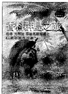
香料群島之旅—追尋「天擇論」幕後英雄華萊士 提姆著, 廖素珊譯 馬可孛羅/8807