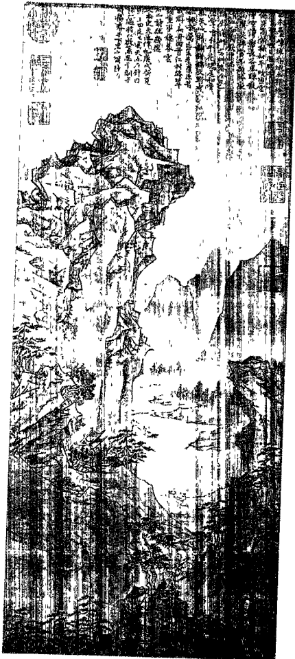
▲圖三 陸治，〈天池石壁〉，1550年，絹本設色，70.6x30.3cm，臺北故宮

，感而有詩：『城南風雨忽悽其，野竹疏花目及時；何似當年無繫累，焚香煮茗畫烏絲。』(10)此外，陳淳的堂弟也與陸治熟識，陸治一首贈予陳訥的詩云：「老去從君事隱淪，大焦岸嶠雨馳神，流連杯酒通千里，脫落形骸見二人，問難直交消永夜，論心幾度聽司晨，雲林花月清平日，相與逍遙七十春。」(11)陸治在書畫方面亦多與朋友分享或合筆，如他與王穀祥（一五〇一至一五六八年）作〈海棠木蘭〉，兩人各畫木蘭花和海棠花合而爲一，王穀祥也曾題詩於陸治〈山水軸〉。以此文人雅趣的畫題亦見文嘉與陸師道（一五一七至一五八〇年）題陸治〈仙山樓閣〉(12)，彭年題陸治〈水仙海棠圖〉等(13)。而陸治和王寵（一四九四至一五三三年）也相當熟絡，王寵曾記述陸治冒著大風雪過訪的經過，其詩云：山人夜擁蒲團作，萬木風翻鳥巢墮，吳山雪暗天嶺迷，笠澤水堅虎豹過，故人忽動王猷興，孤舟力與風相競，柴門泥濘一尺深，落葉都迷蔣生經，病中把袂喜欲鶩，登堂一笑春風溫，紅爐炙手茗杯熱，高談中夜舒琴樽，人生離合那可期，歲月不待浮雲馳，