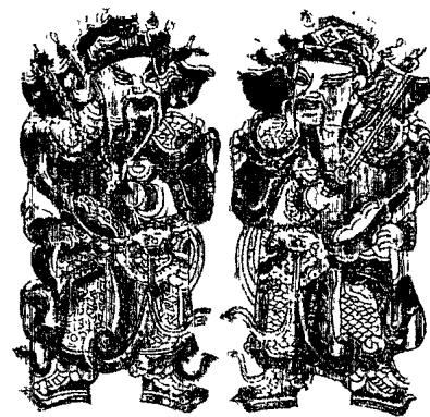
▲正月初一，給二神貼戶左右，避邪除崇，俗謂「門神」，此為福建漳州出品之「小門神」。

的，是日至寺廟燒香拜拜，是為行香，接下親友間相互拜年。但在今日習俗似有改變，尤其政府單位也在鼓勵所謂電話拜年，似為節約時間，避免干擾，其實拜年之不時興，已不待政府提醒，有的人家除夕夜即麻將通宵達旦，次日已無精力出外走動了。但元旦也比較有機會