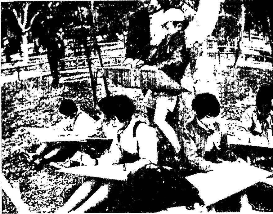
▲ 臺北市第五屆國校兒童寫生比賽（1956·3·27）