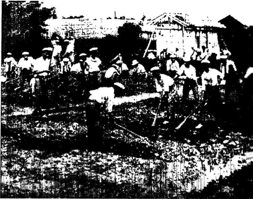
▲ 師範學校農業實習課（約1946年）