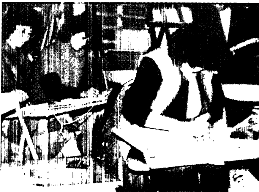
▲ 國小教師美勞新課程研習活動（約1993年）

化、本土化、理論思想與美術教育專業知識的探討以及藝術創作與科技的結合。分別顯示出在高等教育越趨開放的政策下，不同大學所發揮的個別特色以及配合社會文化需求所因應的改變，並強調美術教育與生活的結合。此外，「臺灣美術概論」課程的開設，則反映了目前臺灣社會強調本土化發展的趨勢。