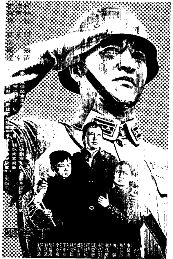
▲ 臺灣政宣片的重要作品之一《八百壯士》。

展」(New Directors/New Films Festival)，楊德昌一九八六年的作品《恐怖份子》也在一九八七年的八月，榮獲瑞士「盧卡諾國際影展」(Locarno International Film Festival)的銀豹獎。兩人在日後的作品包括侯孝賢的《童年往事》、《戀戀風塵》、《悲情城市》、《戲夢人生》、《好男好女》和《再見南國、再見》，楊德昌的《青梅竹馬》、《牯嶺街少年殺人事件》、《獨立時代》和《麻將》，都成為臺灣電影在國際影壇為人追蹤觀察和評論研究的焦點。