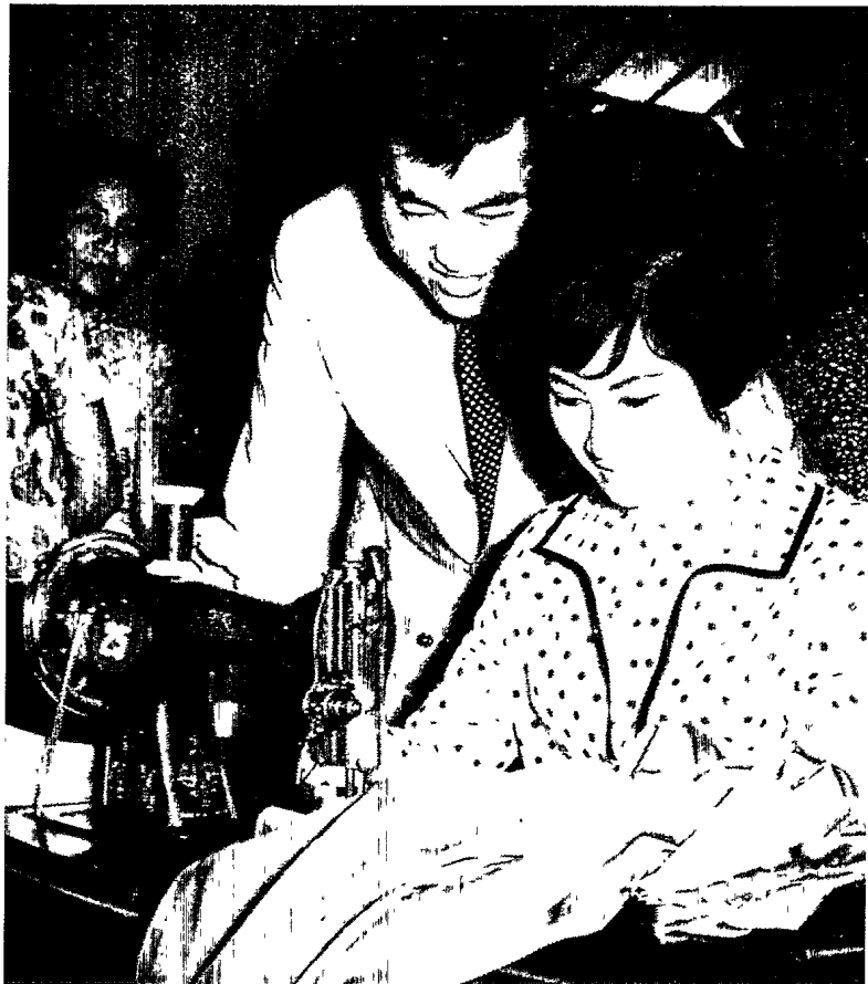
▲ 凌波的《梁山伯與祝英台》(香港邵氏)推動了臺灣國語片的風潮。

○年代已經達到成規、原則、公式化甚至僵化的階段，臺灣電影美學的發展歷經七○年代，似乎也步其後塵。另一方面，對於這個成規、原則、公式化甚至僵化的電影美學表現，六○年代初期的「法國新浪潮」可以是一股自覺、探索和反動的電影美學實踐，然而，在臺灣這股覺醒的美學創作精神，要到二十年之後的「臺灣新電影」於焉出現，那已經是八○年代之後的發展狀況了。