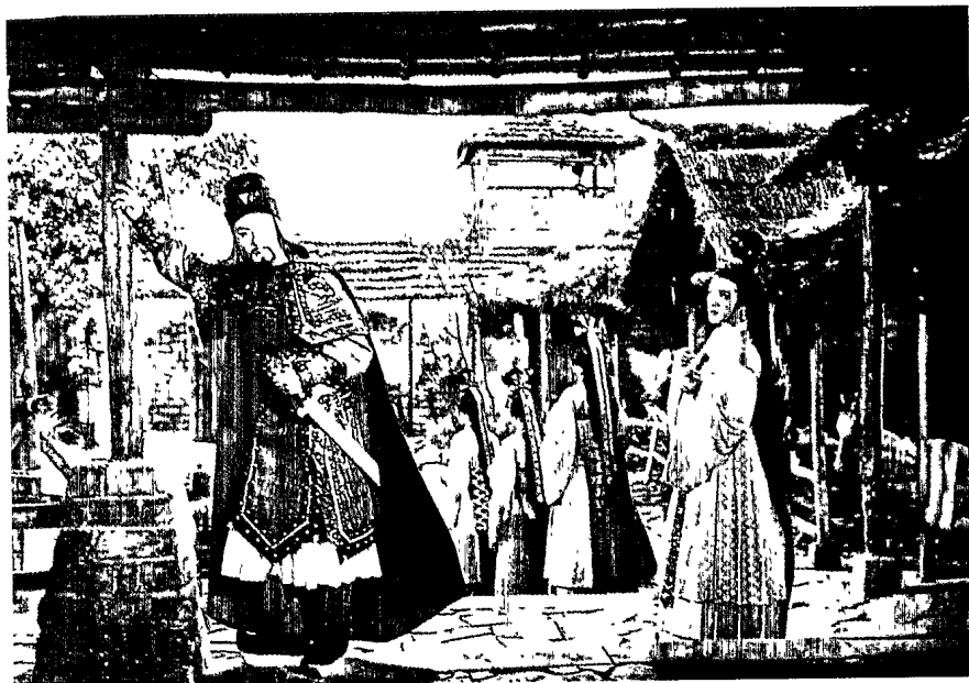
▲ 《西施》臺製（公營）與國聯（民營）合作的歷史鉅片。

緣的犯罪、賭博影片。七〇年代的臺灣電影，不僅在現實政治的挫敗之下，反映出一個扭曲的民族主義狂熱，同時也在這個經濟迅速發展的時代，呈現迷亂和失序的狀態(18)，終至在文化意涵上益形虛浮而空洞，進而為八〇年代之後，文化發展多元呈現的風貌，奠定了堅實的基礎。