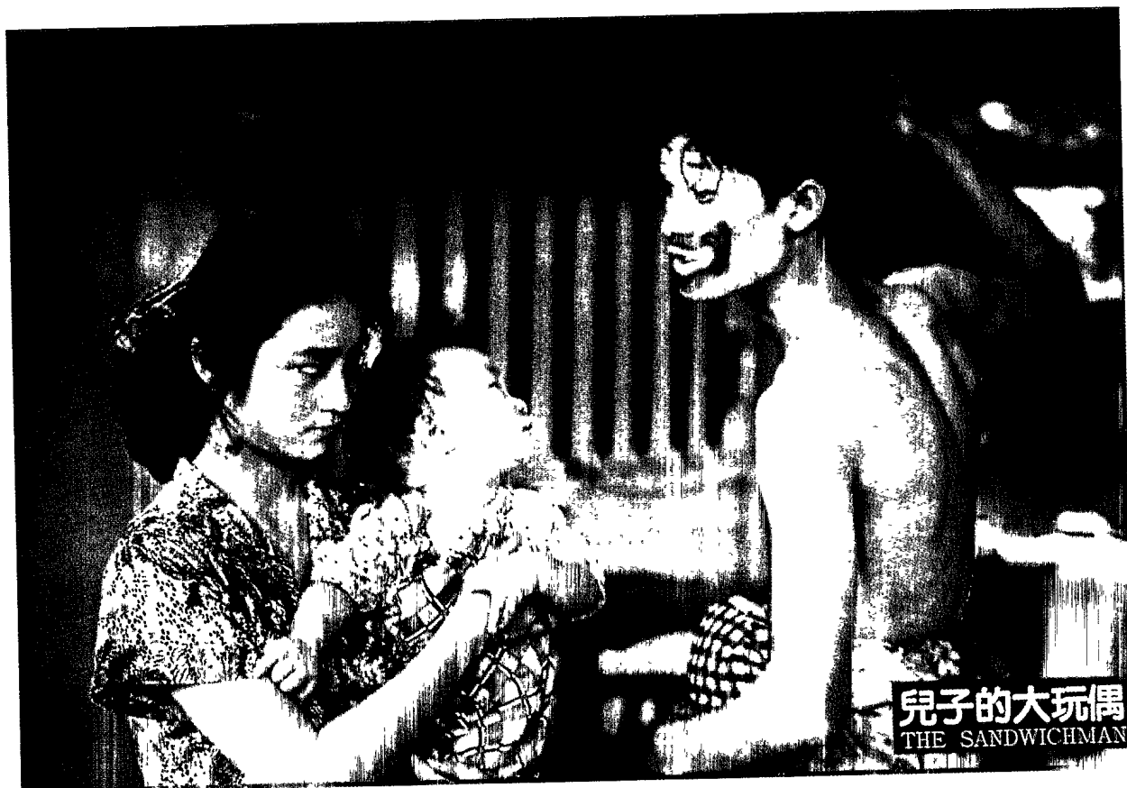
▲八〇年代集結中生代導演的《兒子的大玩偶》，進而奠定「臺灣新電影」的風潮。

曼、羅塞里尼、安東尼奧尼或日本的黑澤明的「藝術電影」；另一方面，它們也同時有著反應當代臺灣變遷社會的價值。紐約時報的主筆影評人文生·甘比(Vincent Canby)的觀點可以代表一般觀眾的看法，也可能說明這些電影為何仍局限於美國大都會的「藝術電影院」映演的事實(20)。甘比以為這些電影(包括侯孝賢的《尼羅河的女兒》)怎麼也稱不上是「年度十大佳片」。這些電影最大的成就僅止於它們只是在一個演變中社會的社會加工品(social artifacts)。如果這些電影可稱之為導演的個人意念表現，這些意念顯然也是源自於一個變遷