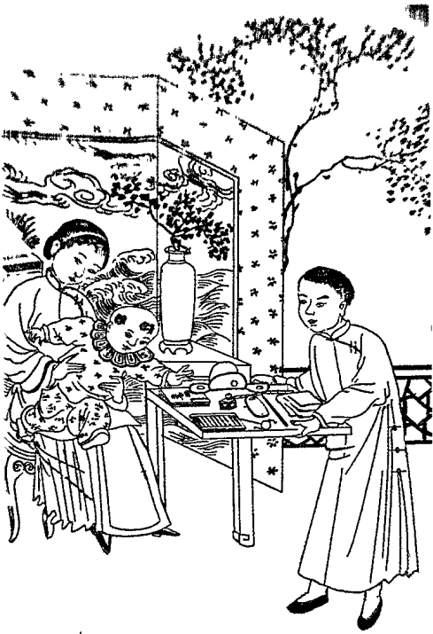
附錄五 象徵符號的分析與解釋

你認為下面的物件各代表什麼意義？請寫出來。寫完後，請對照後面的答案，不同之處，請寫出你的理由。