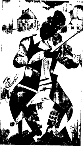
附錄四 夏卡爾的〈綠色提琴手〉作品賞析