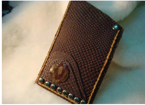
圖 14 創意押花-3C 產品保護套