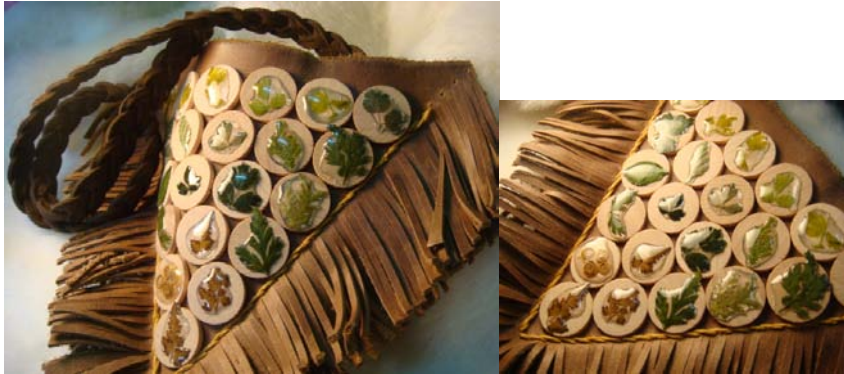
圖 11 台灣原生植物-押花小背包