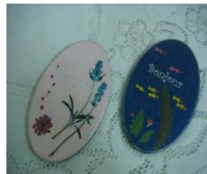
圖 4 冷熱壓膜試驗