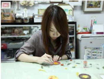
圖 5 印染與彩繪測試