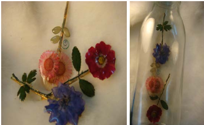
圖 12 台灣花材-飄香髮夾

作品規格：長 6 公分，寬 2~3 公分 使用媒材：台灣針葉菊、野玫瑰、玫瑰葉、小飛燕、金屬髮夾平台。