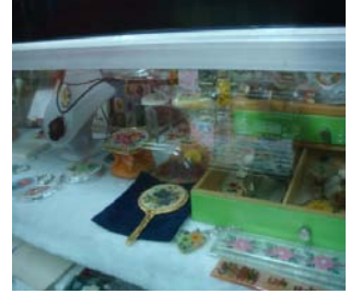
圖 7 技法測試樣品