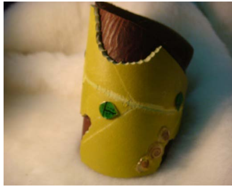
圖 13 綠葉押花-皮革手環