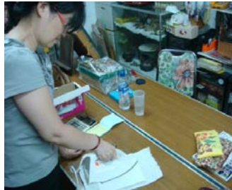
圖 6 裁製與縫邊測試