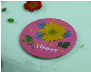
圖 2 花材拼貼試驗

研究如何將押花技巧運用並結合於異類材質上，此項測試將找出最適當之技法與異類材質結合，呈現出押花飾品之創意與設計質感。