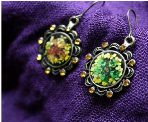
圖 10 小手球與蕾絲花-典雅耳環

使用媒材：台灣小手球（菊紅色、綠色）、蕾絲花（黃色）、古銅耳環、菊黃色水鑽、白膠、AB 膠。