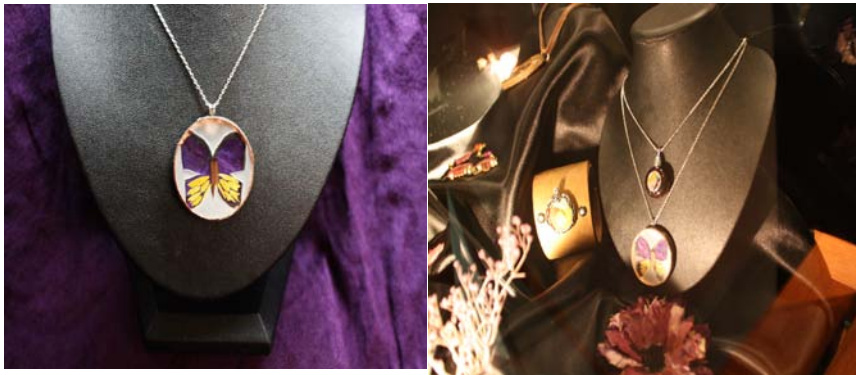
圖 9 台灣鳳蝶造型-押花項鍊

使用媒材：台灣飛燕草（紫色）、千鳥草（黃色）、小果實（黑色）、樹枝（咖啡色）、玻璃、緞帶、鋁箔膠帶、白膠、相片膠。