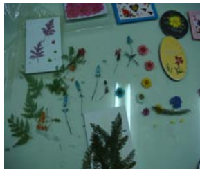
圖 3 乾燥花材試驗