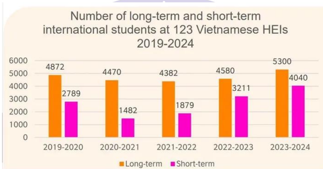
圖 3.在越南 123 所大學學習的國際學生人數

在這些數據中，長期學習的國際學生主要來自區域內國家，如寮國、韓國、新加坡、柬埔寨和中國。短期學習的學生也以亞洲國家為主，包括韓國、中國、新加坡、菲律賓及法國的學生。這些數據表明，越南的國際教育吸引力仍需進一步提升，以吸引更多來自不同地區的國際學生。