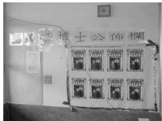
小博士、小碩士、小學士選拔