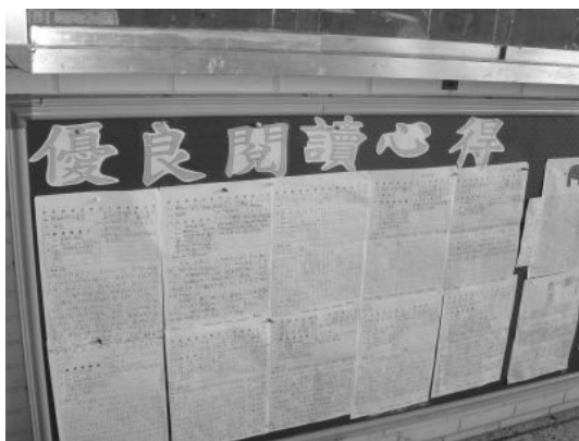
學習心得寫作及設置童話世界櫥窗