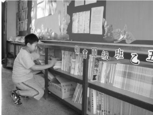
愛的書庫借閱活動