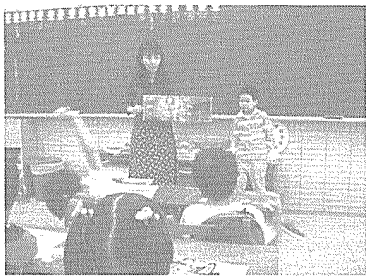
學生發表閱讀的心得