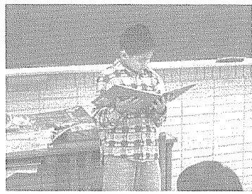
學生唸共讀好書給大家聽