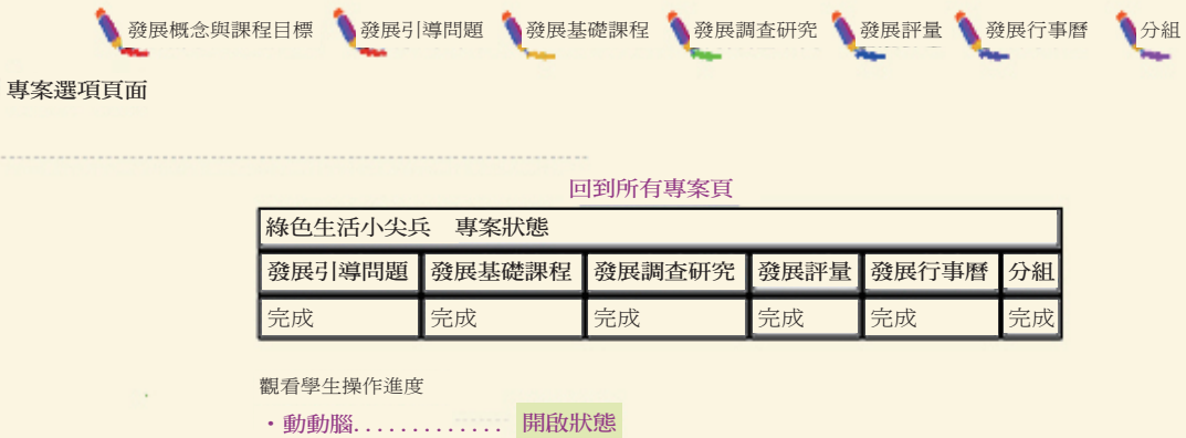
圖2 教師端專題發展

實驗組透過網路專題式學習教學網站進行學習，而控制組則進行傳統講述式學習，同樣搭配有課程網站，兩組學習歷程中皆結合自我調整學習策略之應用，並於課堂中講解自我調整學習的概念與策略。網站係根據Krajcik等人（1999）所提出的專題發展歷程（Krajcik et al., 1999）做為網站架設的基礎，以其所提出的「教師發展專題」與「學生學習專題」的兩個相對面向來設計網站，希望建置網路專題式學習的學習平台，讓教師可以在「教師端」將課程與相關學習資料放置網站上，並經由這個網站來控管教學的流程與進度，學生也可經由這個網站獲得教師所提供的課程內容進行自主學習，而網站也會將學生的學習歷程做記錄，讓教師能夠了解學生的學習狀況，如圖2所示。