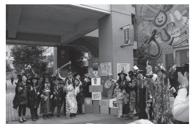
兒童節創意變裝秀