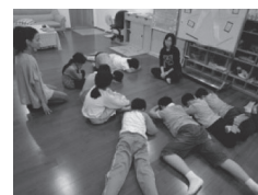
小團體活動_人際互動