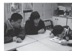
視障巡迴輔導老師進行視覺評估協助特教生學習