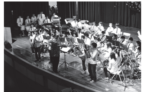
藝能科才藝發表會 _ 管樂團表演