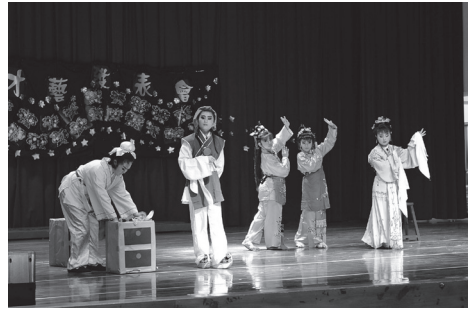
歌仔戲年度社區展演

本校秉持回饋社區、與社區良性互動的原則，每逢學生才藝發表活動，五月學生藝能科才藝發表會，及本校特色社團歌仔戲公演，六月配合畢業系列活動，舉辦畢業生美展，十一月前後校慶體育表演會及十二月感恩音樂會，希望與社區共享，型塑社區藝文風氣。