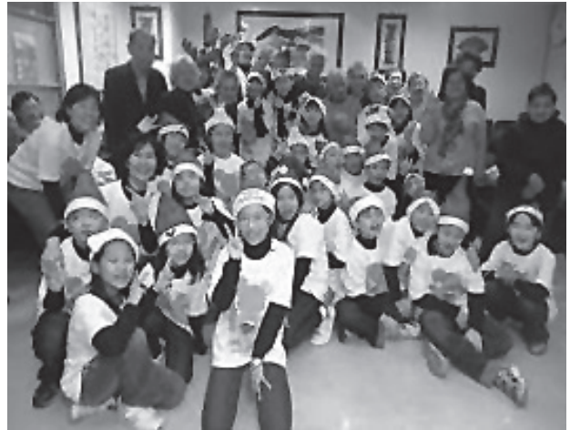
探訪失智老人中心

10. 外界肯定辦學，獲得媒體大幅報導光仁卓越品牌，屹立不搖。傑出畢業校友享譽國內外。不論是在學科或術科成就上，皆受到外界肯定，學生優質素養與氣質受媒體肯定。