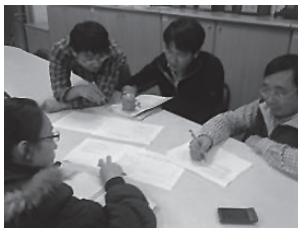
學年領域教師對談