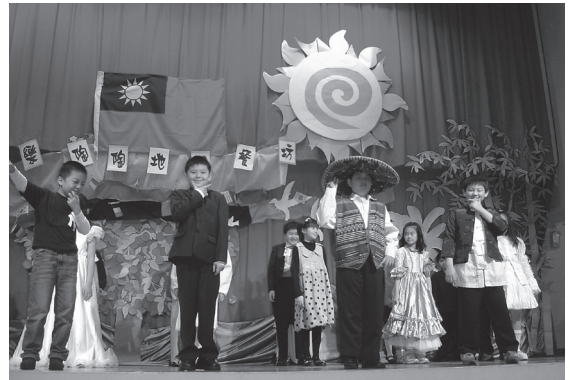
多元文化體驗及表演

光仁以博愛為校訓，發展全人教育。不但重視學生基本能力的培養，更重視孩子的人格及品