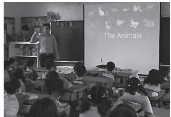
定期舉行教學觀摩