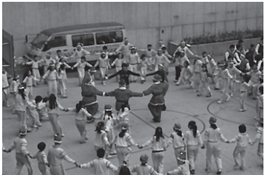
全校性聖誕節慶祝活動