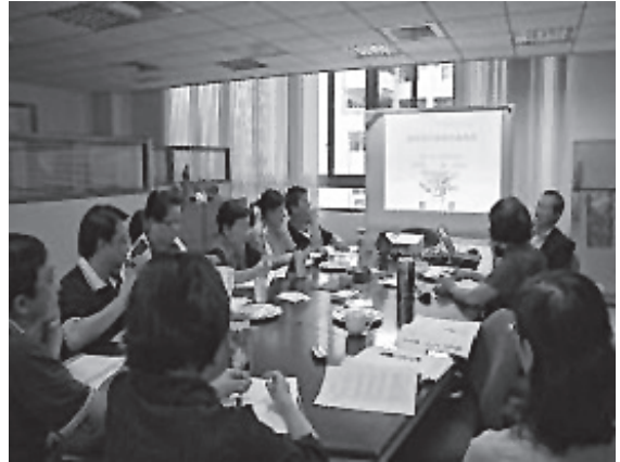
辦理多元進修及研習

全體教師以全人教育為本，配合學校願景，落實校訓「博愛」的精神，規畫多元的校本特色活動。