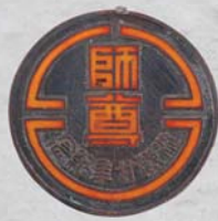
臺灣省教育會教師節從教20年紀念章

民國76（1987）年教育部簽報行政院通過，將九所師範專科學校改制為師範學院，培育大學程度之國民小學師資；另將高雄師範學院及臺灣教育學院改制為高雄師範大學及彰化師範大學，以培育中等學校師資，自此確立臺灣中小學師資皆為大學畢業程度（吳鐵雄、李坤崇，1997）。