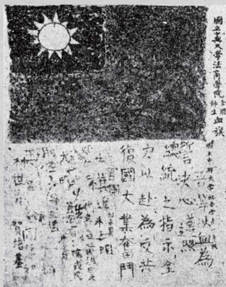
我國被迫退出聯合國，中興法商的大學生以血染國旗來明志。（遠流出版社提供）