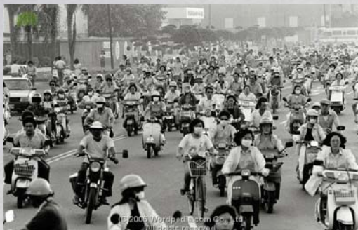
萬「車」齊發的盛況，是高雄加工出口區著名的下班風景。

就經濟發展而言，民國57（1968）年開始籌建之高雄楠梓加工出口區，於民國60（1971）年完成，吸引許多國內外工業投資，臺灣成為世界製造工廠；接著十大建設自民國63（1974）年起，至民國68（1979）年底次第完成，十大建設的實施，不但便利了交通運輸，創造了許多就業機會，也提升