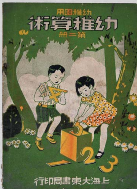
幼稚園教材

法規中並明定私立、公立幼稚園設立之課程、設備、衛生條件等標準、園長及教師之資格，確保幼稚園教育品質。