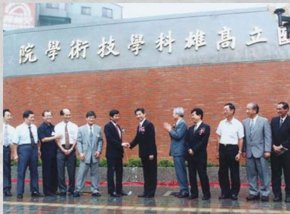
改制技術學院

政府除配合建立科技大學、技術學院、社區學院、專科學校、高級職業學校、綜合高中與國民中學技藝教育的一貫教育體系。並制定《社區學院設置條例》，輔導績優專科學校、綜合高中、職業學校、職訓中心及社會教育機構改制為社區學院，以符合社區民眾需求，提供社區終身學習的教育機會。