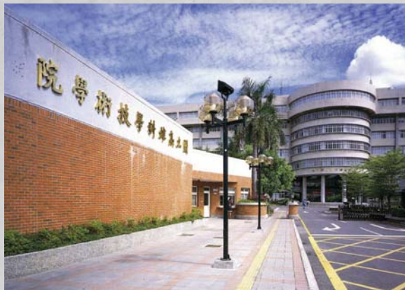
86年 國立高雄科學技術學院（今國立高雄應用科技大學）