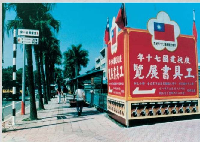
民國70年9月19日舉辦「慶祝建國七十年工具書展覽」

對於外國大學直接尋求教育部資助研究計畫或捐贈基金之案件，國際文教處係依據以下三原則處理：