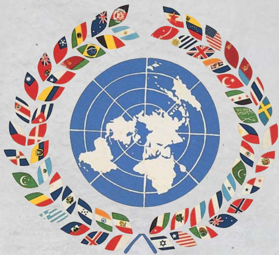
1956年的聯合國賀年卡上，當時，我們還在啊！（莊永明提供，遠流出版社提供）

另外，民國76（1987）年政治解嚴之後，開放黨禁、報禁，由軍事戒嚴邁向民主憲政，政治、經濟、社會、文化、宗教、教育各方面蓬勃發展，也提供各層面改革的環境。民國83（1994）年「四一〇教改」大遊行，提出小班小校、廣設高中大學、制定教育基本法、教育現代化四大訴求，加速教育邁向改革的大道。