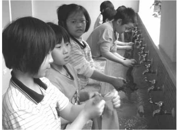
▲ 低年級學生實際操作生活課程「洗抹布」