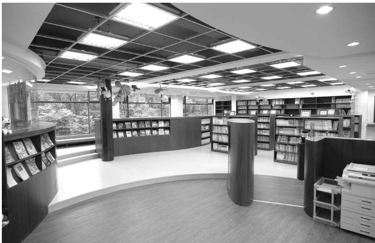
▲ 寬敞新穎的圖書空間規劃，成為學生最喜愛的學習場所

擴大參與基礎，並適時將學生優質表現以最新活動訊息與動靜態實作影音檔案發布於學校網站，讓親師生都能透過網路線上即時欣賞，分享學習成果與成長喜悅，也讓萬福學生學習特色與更多關心教育的伙伴分享。