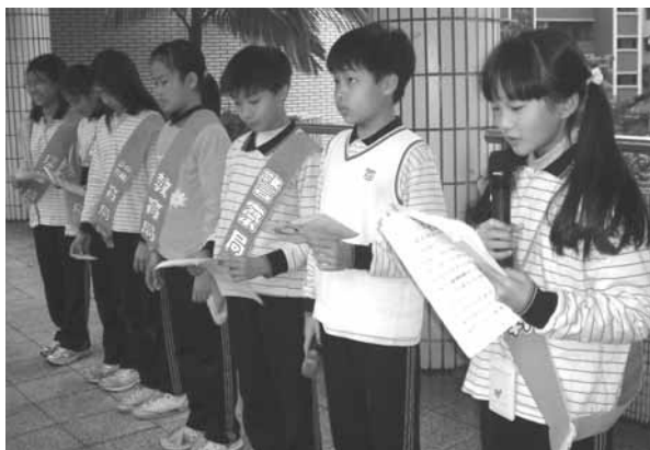
▲學生自治會幹部於朝會時間報告品德小故事及具體行為實踐

在27類54班次的充分而多元社團的自由選擇中，在二、五健身河濱寬廣無限的場域及生活技能的培養下，讓孩子有匆容的餘暇，快樂的選擇，探索屬於他們自我密碼的學習。