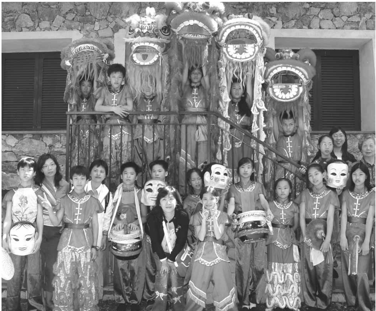
▲ 本校雜技隊參與2006年義大利春天節活動合影