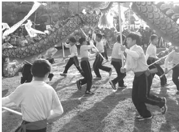
▲ 高年級學生於體表會時表演舞龍展現學習成果