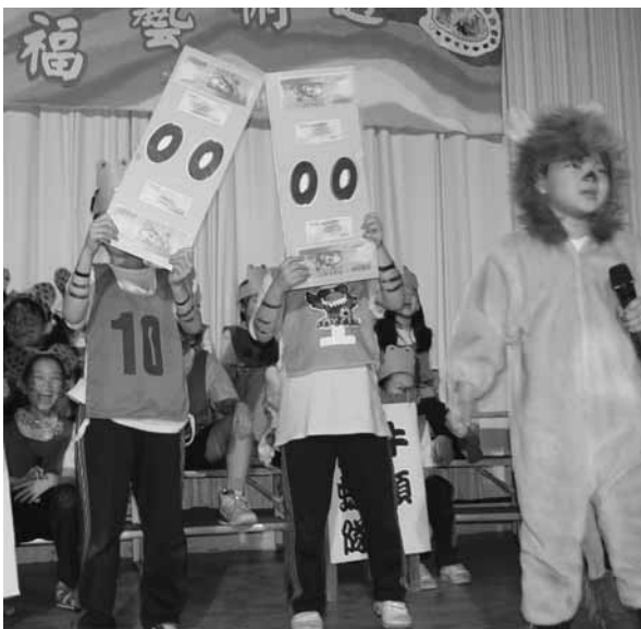
▲ 學生以數學音樂話劇呈現藝文課程學習成果

與潛在課程中，獲得適合適性發展的機會與選擇。未來，萬福國小將以更精緻的方案推動面向，持續引導學生朝向「樂於向學、回饋所學」的終身學習新方向。