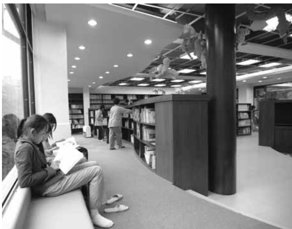
▲學生於圖書室自由的閱覽，品味讀書的樂趣與學習的快樂