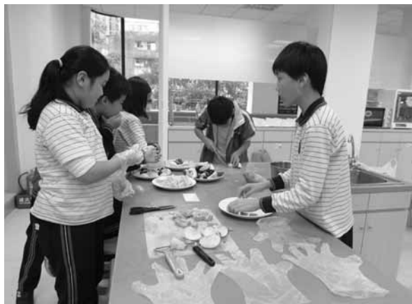
▲ 高年級學生實際操作生活課程「水果拼盤」

透過SWOT分析、TOWS矩陣評估策略分析及方案目標，並依學校願景，整合行政組織與教師團隊的共識，據以擬定「健康磐石」、「民俗體育」、「多元社團」、「才藝競秀」、「日日閱讀」、「品味閱讀」、「生活課程」、「品德教育」等八項學生體驗學習項目，並歸納為『健康促進』、『動靜皆秀』、『歡喜閱讀』、『生活容易』等四大主軸，以培養並提升學生十大基本能力，轉動萬福學子體驗學習新契機。