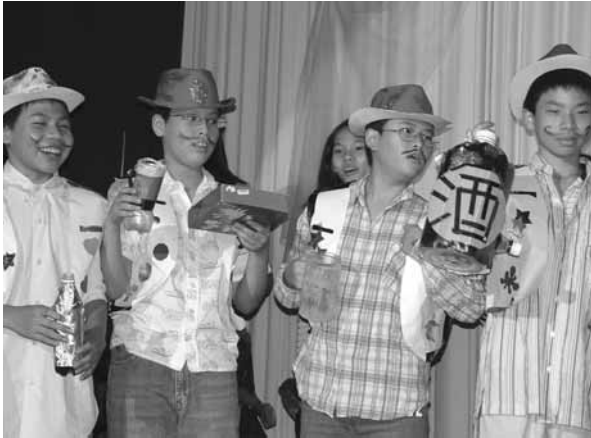
▲ 提供展演舞台讓學生表現多元才能

身障體驗活動，讓學生在體驗遊戲中體認到身心障礙者的困難，並進一步能發揮同理心，主動關心和協助身障人士。