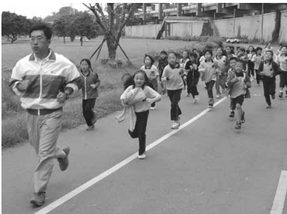
▲ 教師帶領學生於景美河濱公園進行跑走活動