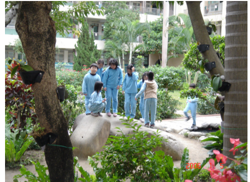
圖 7：下課時間女生在庭園內的石頭上聊天。

校園生活休憩空間內休憩活動的友人數方面，男女學童休憩活動友人數都以跟二至四個同學為主，而選擇跟一群同學的男生人數顯著多於女生，而選擇跟二至四個同學和跟一個同學的女生人數顯著比男生多，因此男生傾向跟大團體玩，女生傾向跟小團體玩。