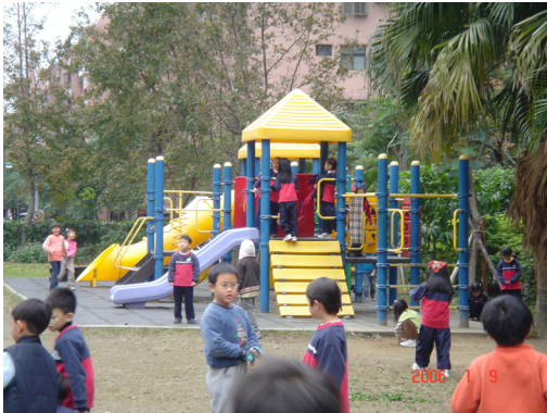
圖 4:下課時間學童在遊戲場玩組合遊具。