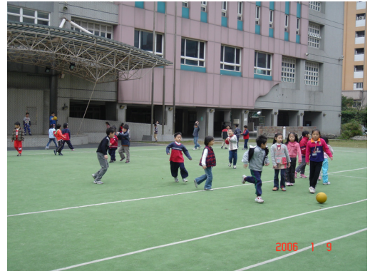
圖 5:下課時間學童在田徑場的跑道上玩球。