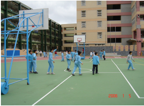
圖 6：下課時間較多男生在室外球場上打籃球。