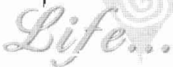
附錄：高雄高工生命教育發展圖