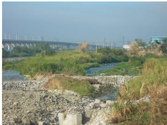
筏子溪水灌溉的農田