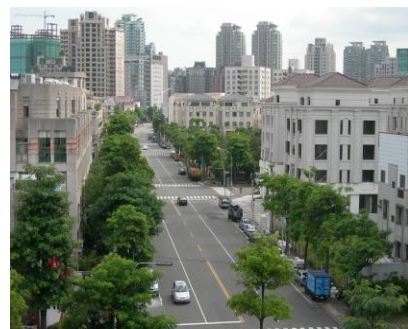
從惠文國小五樓教室看出去的景觀