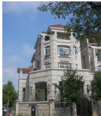
學校附近到處都是這種別墅建築。