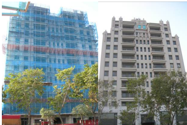
惠文國小校門口，迅速完成的建築。左邊為建築中，右邊為建築完成。