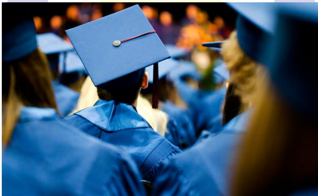
圖 1. 隨著紐約州高中畢業考試豁免政策的到期，紐約市 2025 年畢業生的畢業率下降。身心障礙學生和英語學習者的畢業率降幅尤為顯著。

這批學生於 2021 年進入高中，正值疫情後首次全面恢復實體上課，外界認為部分學生在升學準備上可能受到疫情期間學習中斷的影響。儘管如此，目前畢業率仍高於疫情前水準。疫情前紐約市約 77% 學生可在四年內畢業，紐約州約為 83%。