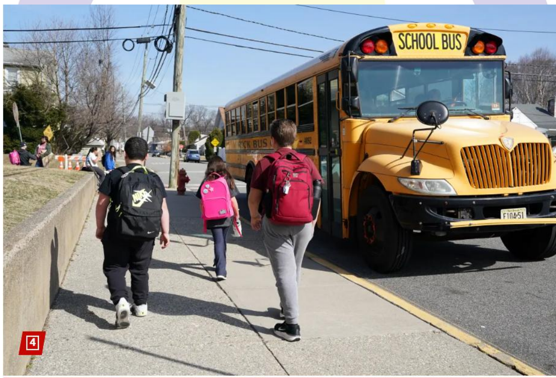
圖 1. 紐約市學生在課堂上花費的時間少於全國平均。

根據發表於《American Educational Research Journal》的一項 2025 年研究，全美一般 K-12（中小學）學生每年上課 178.6 天，每天約 6.9 小時，全年平均約 1,231 小時。研究人員分析 2017 至 2018 年「全國教師與校長調查」（National Teacher and Principal Survey）的資料——這是目前最新且最完整的相關數據——據此計算出基準值。