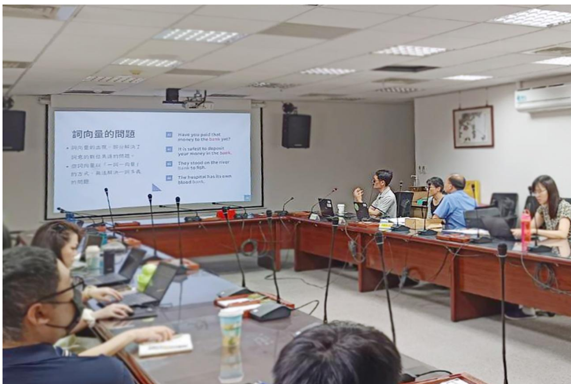
AI 於佛教文本之應用演講現場