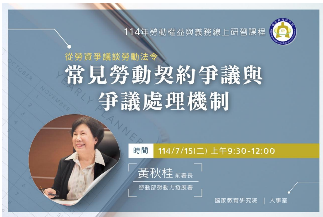
演講活動海報