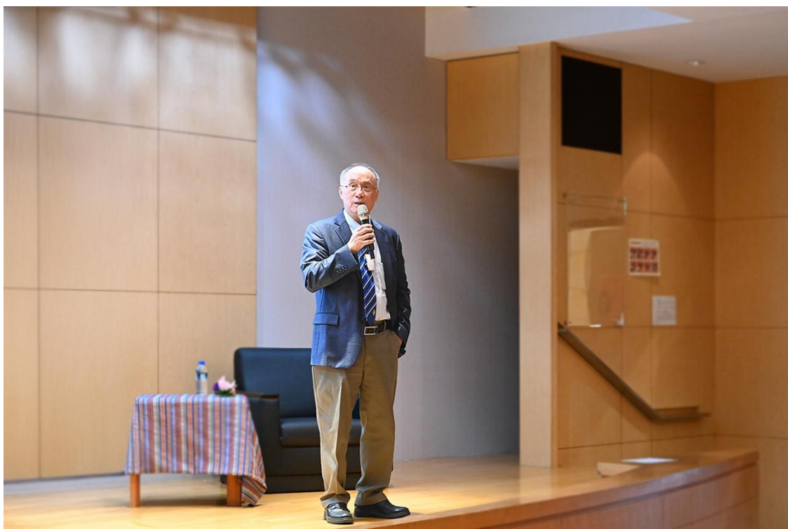
梁賡義院士分享其學思歷程