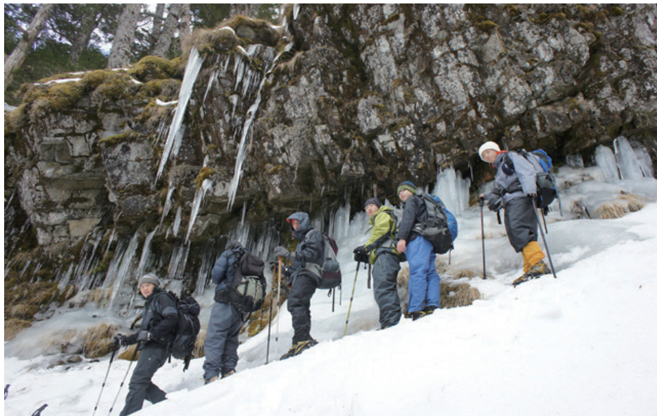
圖2 道禾的自然之路：一年一座山，一年一條河。（感謝道禾實驗學校提供照片）

將學校視為一所學習村落，強調生態永續發展，依循節氣生活，一年一座山，一年一條河，進入自然環境學習，從雅文化與藝術活動體驗，發展「為己之學而非為人之學」的學校教育。2011年經營管理道禾六藝文化館，以「藝文活化歷史建築」、「再現六藝創新活動」為策略，落實文資保存並發揚傳統文化，舉辦藝文活動與課程，成功營造場域文化氛圍，成為區域文化與藝術亮點。目前於苗栗三義興建佔地約八公頃之現代書院式人文生態耕讀村落，以「親子共享、四季循環、社群參與、多元藝術」為空間核心價值，具體實踐「人文、生態、教育」的學習村落，體證「直心中觀、天然首學、知行合一」之教育旨趣，期發展自幼兒園至高中的一貫學制，以「正德、利用、厚生、惟和」為教育目標，成為華人文化教育的研究與實踐場域。