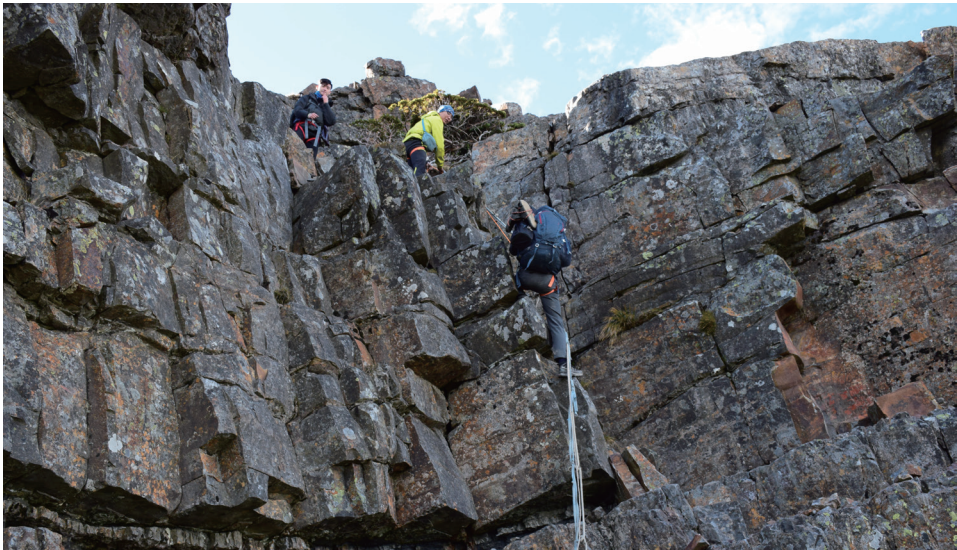
圖 5 全人實驗中學每年全校登大山，師生不但每年走入山林，體驗大自然之美，也從中自然發展團隊合作、領導統御能力和過人的生命膽氣。（感謝全人實驗中學提供照片）