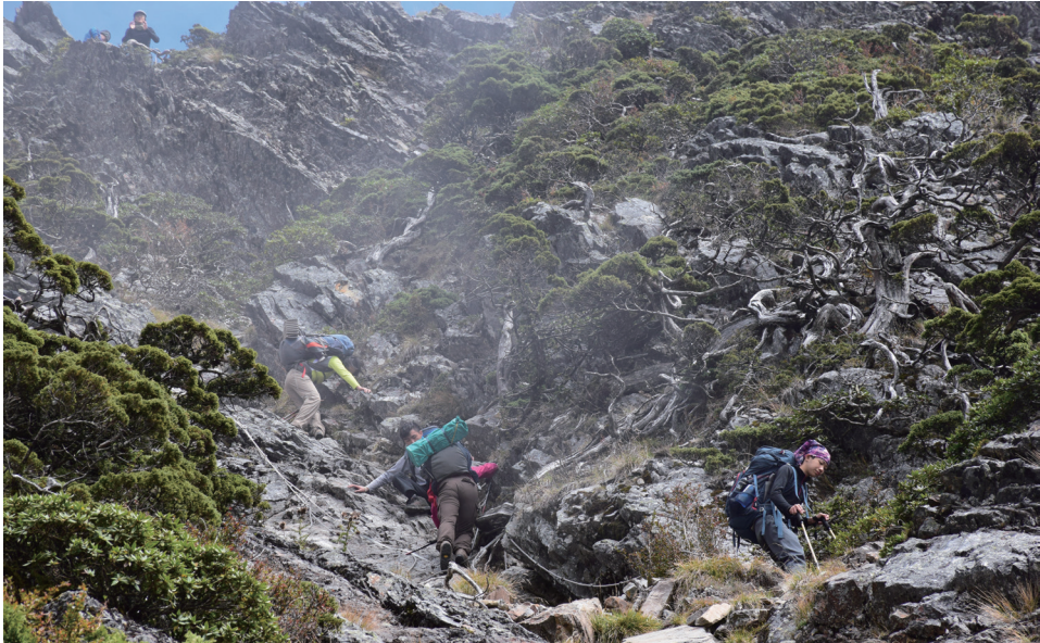
圖 4 全人實驗中學自創校至今 23 年，全校教職員生每年都會重裝攀登 3000 公尺以上大山，登山總召、小組長、輔導員皆由國、高中學生擔任，帶領全校師生進行為期二個月體能訓練，並完成 5-7 天的登山行程。