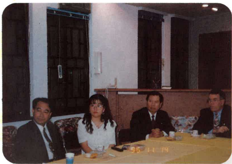
八十四年十二月九日本館假台東縣立文 化中心舉辦教育學術講座邀請教育部李 次長建興擔任講座講題為教育問題與對 策。