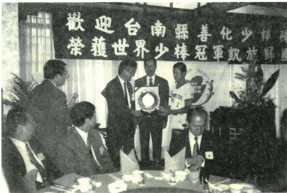
善化國小少棒隊凱旋歸國各界頒獎祝賀，如上圖。

良以世界少棒冠軍寶座，我們中華隊已睽違三年之久，這一次善化國小以秋風掃落葉之勢再次奪回，其有痛快無比之感。這是善化國小少棒成軍十年以來，第二度為國家爭取到的殊榮，時間相距不過五年，實在硬是要得！