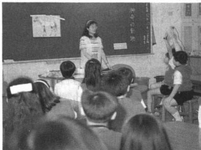
在尊重學生的時候，必須考慮到學生的個別差異而給與人性的對待

黃：完成一件事情，需要大家都盡一分力量，在出力的過程中，只要你盡力去做，就是值得尊敬的人，就不應該有高低、貴賤之分。所以，我教給學生尊重的概念，包括了二部分：對自己而言，要肯定自己做為人要有人性的尊嚴；對別人，要平等的對待他人。在生活教育上，我會舉一些實例和學生討論，在教室經營上，我先盡力把學生教好，這就是對自己、對學生的尊重。另外我會關心低成就的兒童，帶動全班學生來幫助他、鼓勵他，讓學生感受到我是真誠的、平等的對待他們。在教學過程中，我也會要求他們共同完成一些事，讓他們在理性討論的過程中，知道如