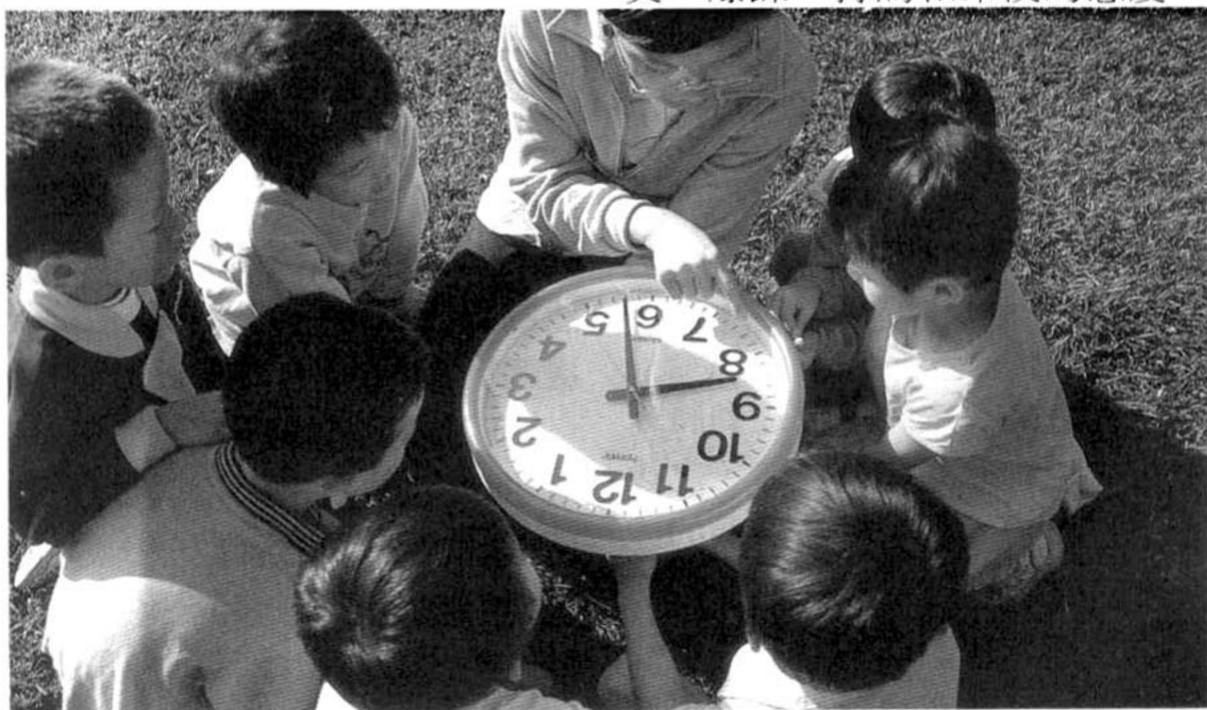
學齡前的孩子，幾乎完全透過身教來學習，其影響即大得驚人，父母師長不可不注意。

孩子在學齡前的心智發展，尤其值得重視。因為這幾年所學到的東西，就像樹苗、主幹一樣，它們能影響孩子一輩子，特別是在情結和情感方面的影響力更大。倘若這段時間，給了不良的身教，例如大人經常出現衝突、暴躁、打罵和冷漠的態度，