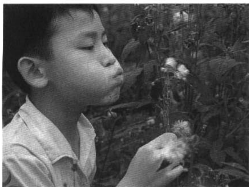
人文教育的主要目的在陶鑄人文精神，培育人文素養

質。心靈改革與教育改革實為一體之兩面，相輔相成，並行不悖。本文擬就人文教育的觀點，析論心靈改革的途徑，俾供教師們參考。