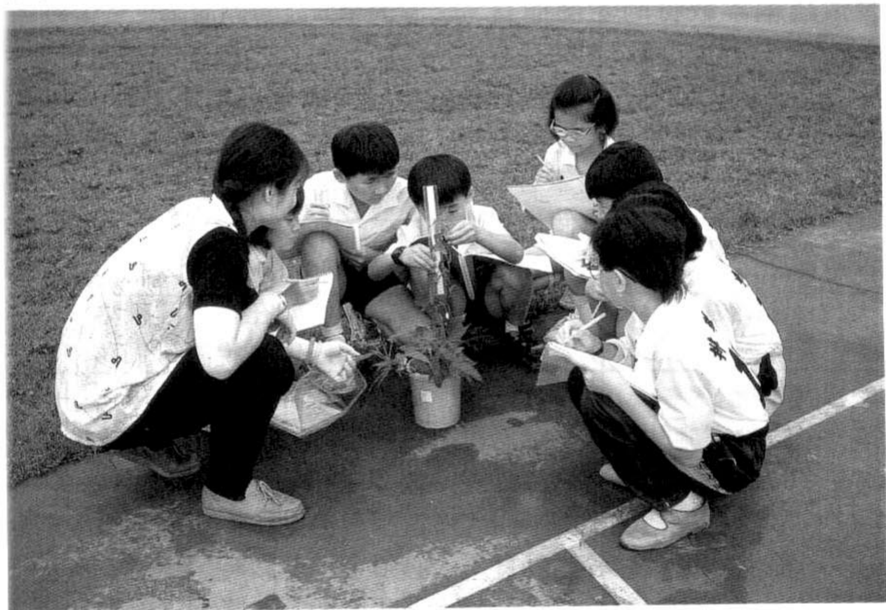
協助兒童培養濃厚的學習樂趣

(三)新課程標準在「生涯輔導」的概念上，較無宏觀的看法，其目標僅局限於「培養兒童正確的職業觀念與勤勞的生活習慣」。然而國小學生在生涯規劃的舞台上，主要是扮演探索者與幻想者的角色。因此必得借重其他輔導活動，努力認識自己，並培養工作及學習的能力，以落實生涯輔