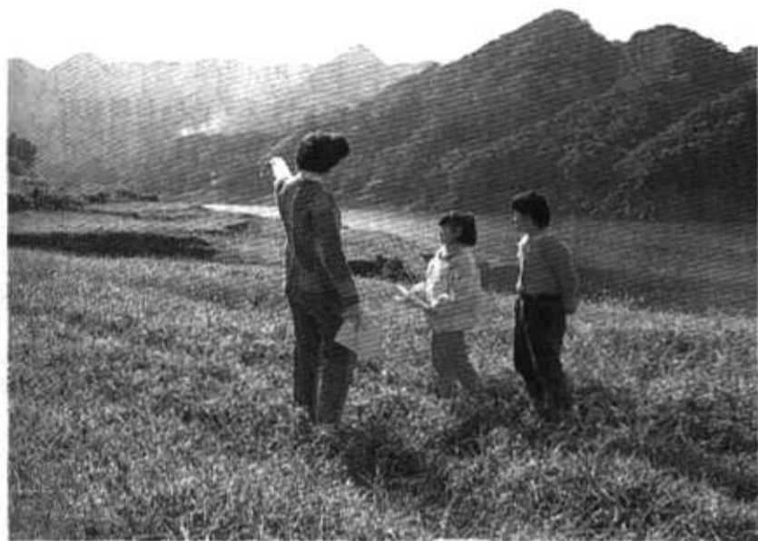
我們相信人有接受普及教育的權利

能的文化機會。學校教育應鼓勵那種令人滿足且富創造力之生活方式。學校應完全開放，供個人或群體使用。追求完美的成就也該加以讚賞鼓勵。革新且具有實驗性的教育方式將會受歡迎。年輕人的精力與理想值得我們讚賞。且也值得引導到具有建設性的用途。