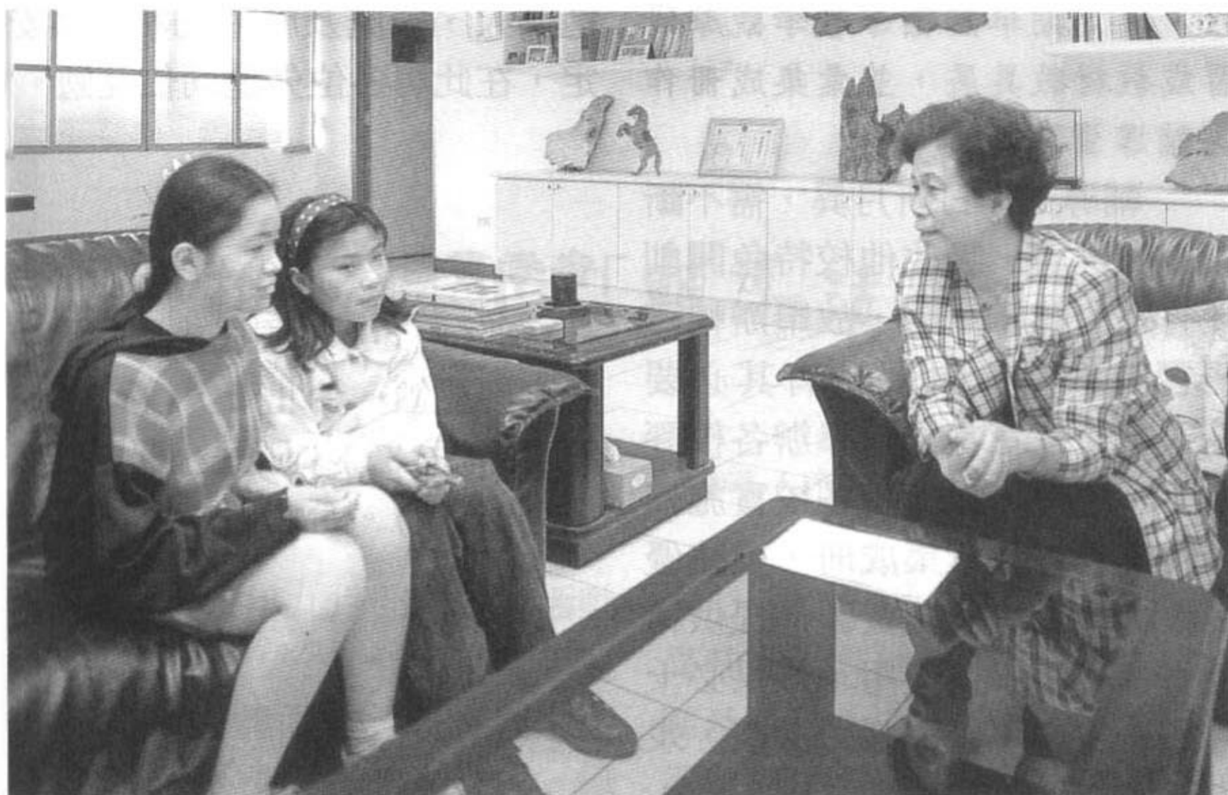
教師應發揮愛心，多參與認輔工作，使學生獲得更好的關照及正向的鼓勵與支持