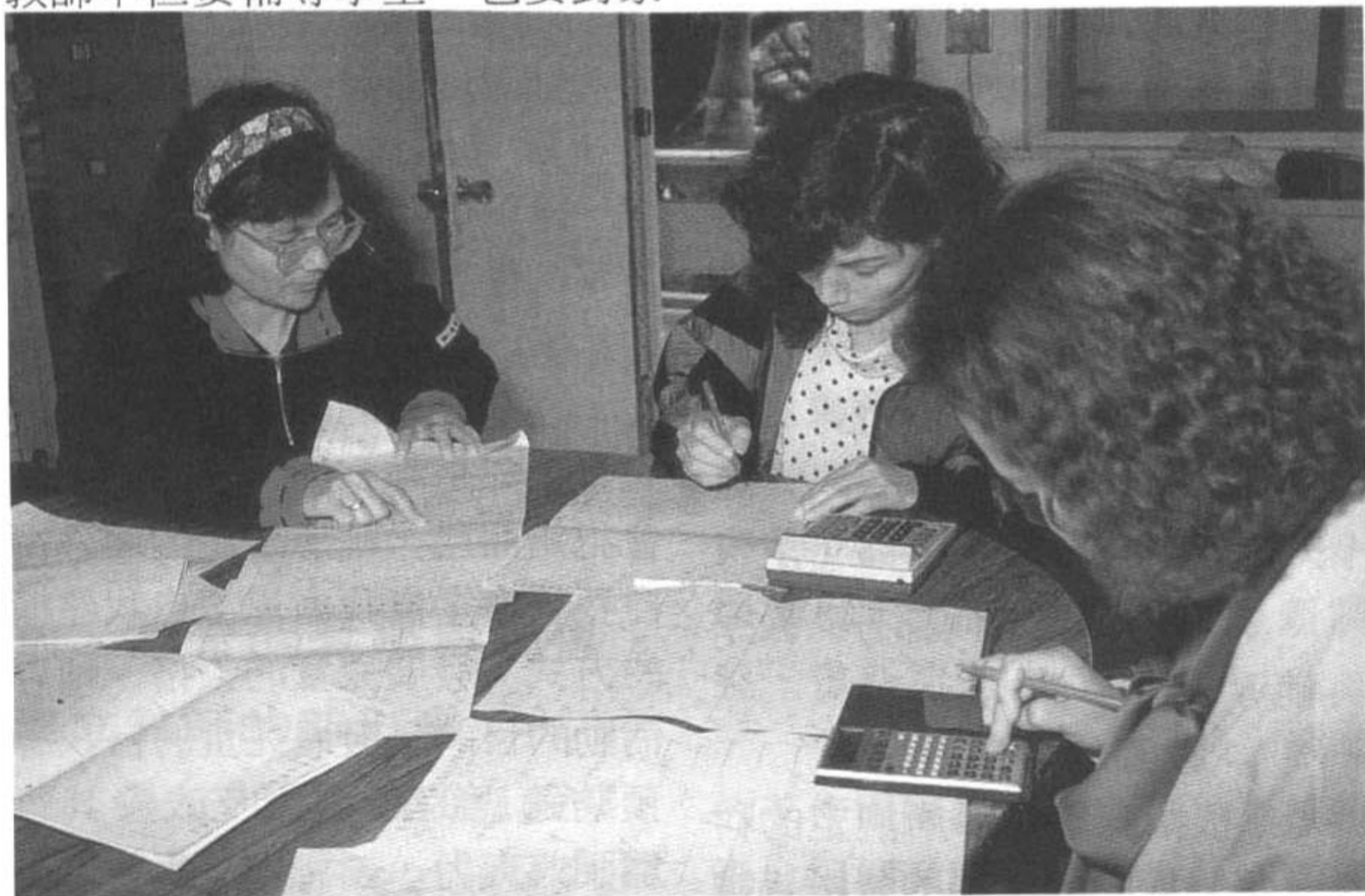
教師要有敏銳的頭腦，覺察到教育改革的新趨勢，必須提昇自我的輔導專業知能