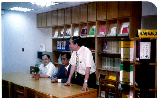
圖一 為本館資料組閱覽室於本年五月一日整修完竣，由毛館長主持啟用儀式並致辭。