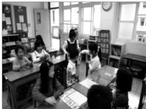
2. 小客人們抽籤決定要拜訪的小主人