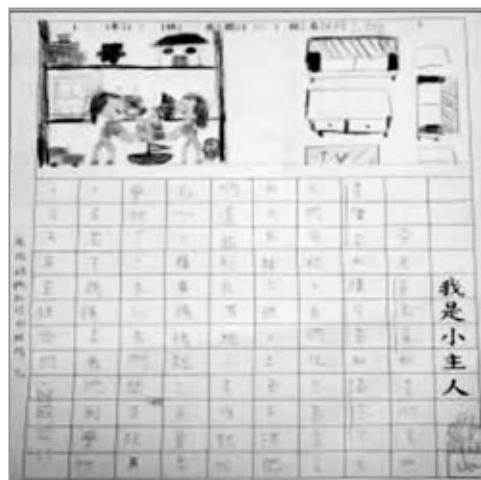
活動結束後，孩子完成的圖畫日記