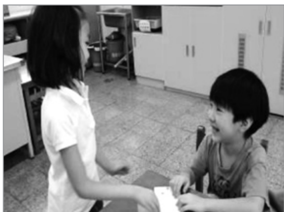
小主人對小客人遞上邀請卡，並有禮貌的邀請小客人