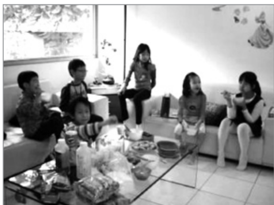
小客人們在小主人家活動情形