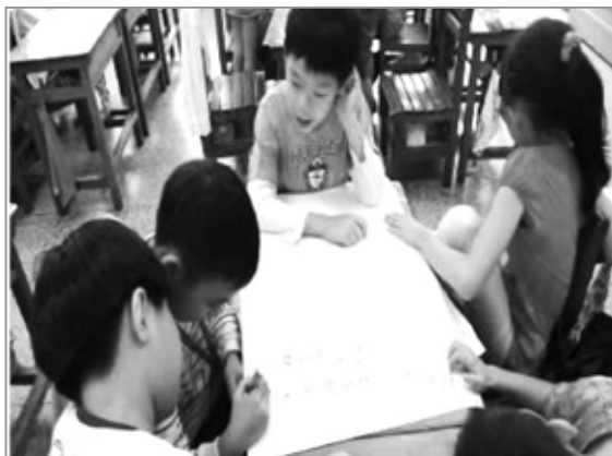
分組討論待客時應有的禮儀