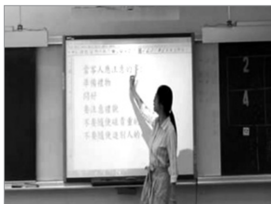
全班歸納擔任客人與主人應有的禮儀