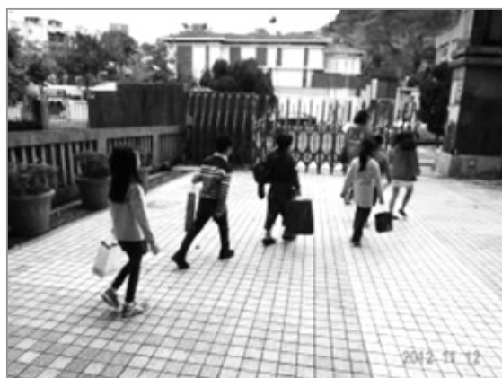
小客人們帶著禮物與小主人、大主人一起出發了！