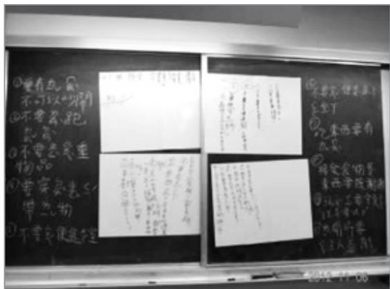
1. 各組討論檢核項目後，全班一起匯整