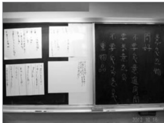
全班一起彙整分組討論的結果