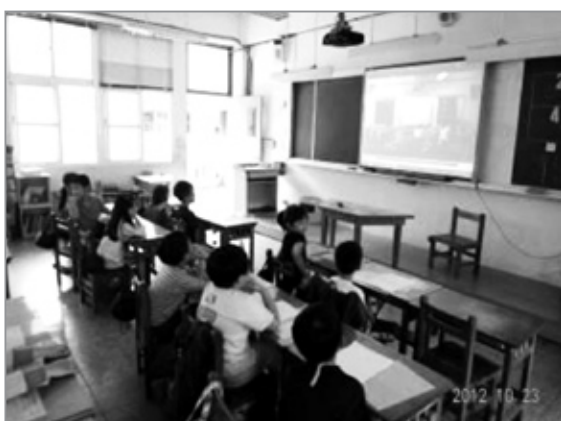
共同觀賞表演的錄影，找出優缺點