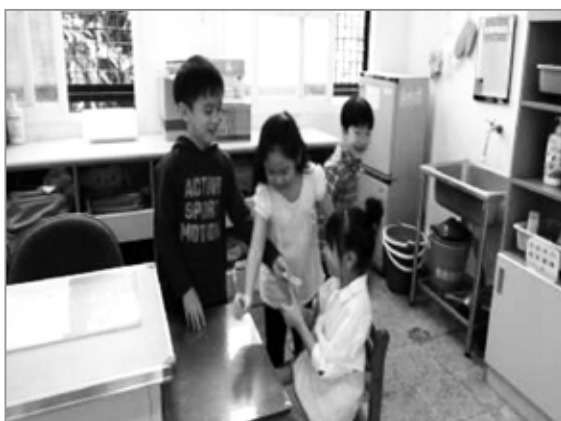
以客人主人為主題，分組練習戲劇表演