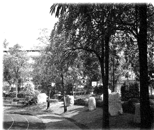
圖一 明道人文環境-文學步道