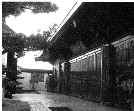
圖四明道人文環境-絃歌講壇