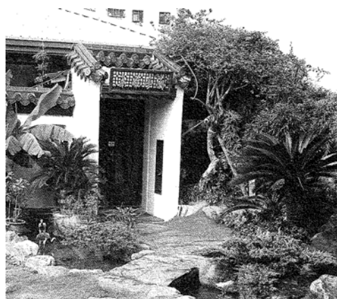
圖二明道人文環境-蘭亭雅趣