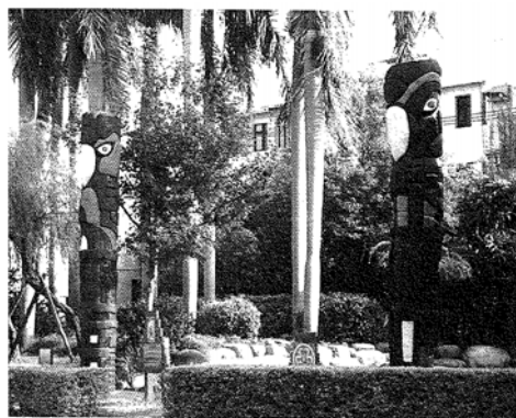
圖五明道人文環境-鷹揚四海