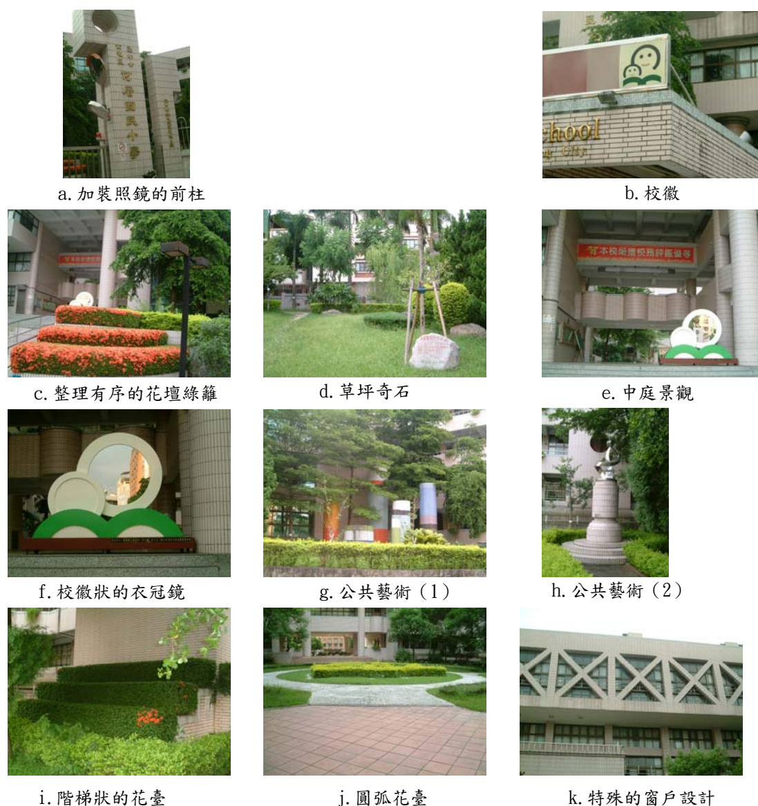
圖 2 何厝國小校園創意設計的設施或空間

以校園創意設計的特徵指標來分，「中庭景觀」、「公共藝術（2）」、「圓弧花臺」、「特殊的窗戶設計」等屬於求新原則（A 特徵指標）。「整理有序的花壇綠籬」、「階梯狀的花臺」、「公共藝術（1）」等屬於求新原則（B 特徵指標）。「草坪奇石」屬於求新原則（C 特徵指標）。「加裝照鏡的前柱」、「校徽狀的衣冠鏡」屬於求妙原則（Q 特徵指標）。共計 10 項校園創意設計。