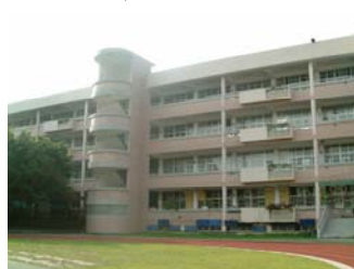
h. 紅灰相間的新穎建築