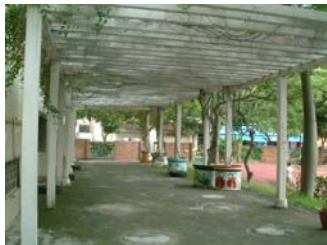
m. 綠廊 (1)