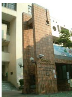
a. 入口 H 型廊柱

以校園創意設計的特徵指標來分，「入口 H 型廊柱」、「門口種竹」、「衣冠鏡」、「司令臺」、「健康步道」、「三角形草坪」、「雙弧形的樓梯」、「拱狀的無障礙坡道」等為求新原則（A 特徵指標）。「實木溜滑梯」屬求新原則（C 特徵指標）。「入口花臺」等屬於求變原則（D 特徵指標）。「中庭」、「廣場石椅（1）、（2）」、「竹風藝廊（1）、（2）」屬於求變原則（E 特徵指標）。「教師休息區」屬於求變原則（F 特徵指標）。「鄉土教學角（1）、（2）、（3）」、「觀魚池」等屬於求進原則（M 特徵指標）。「花園一景」屬於求絕原則（N 特徵指標）。「廊柱間的種植」屬於求絕原則（O 特徵指標）。「綠廊（1）、（2）」、「著色豐富的花盆、石塊」等屬於求妙原則（P 特徵指標）。「洗手臺邊的佈置」屬於求妙原則（Q 特徵指標）。共計 21 項校園創意設計。