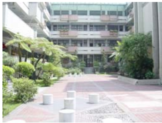
g. 廣場石椅 (1)