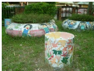
q. 著色豐富的花盆、石塊