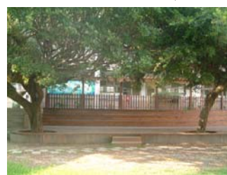
i. 木質的戶外演藝場