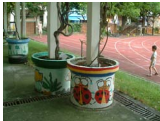
n. 綠廊 (2)