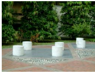
h. 廣場石椅 (2)