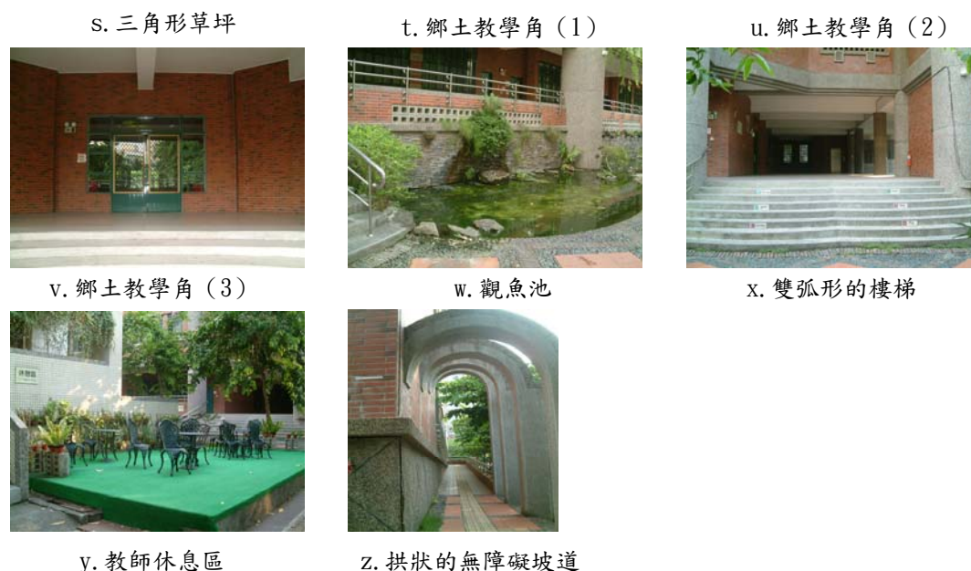
圖 4 重慶國小校園創意設計的設施或空間