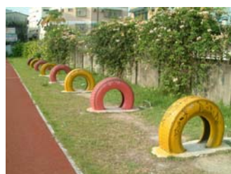
g. 色彩鮮豔的輪胎場