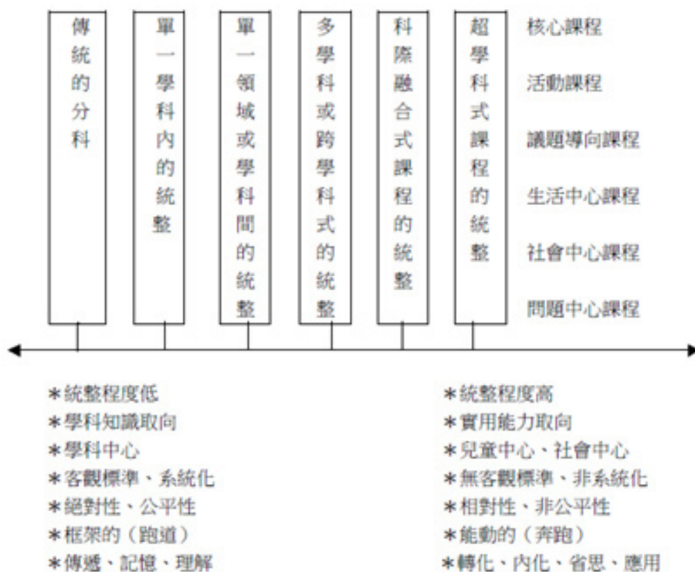
圖 1 統整的取向與統整程度圖