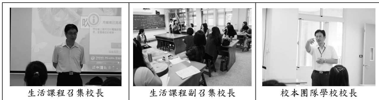
生活課程召集校長