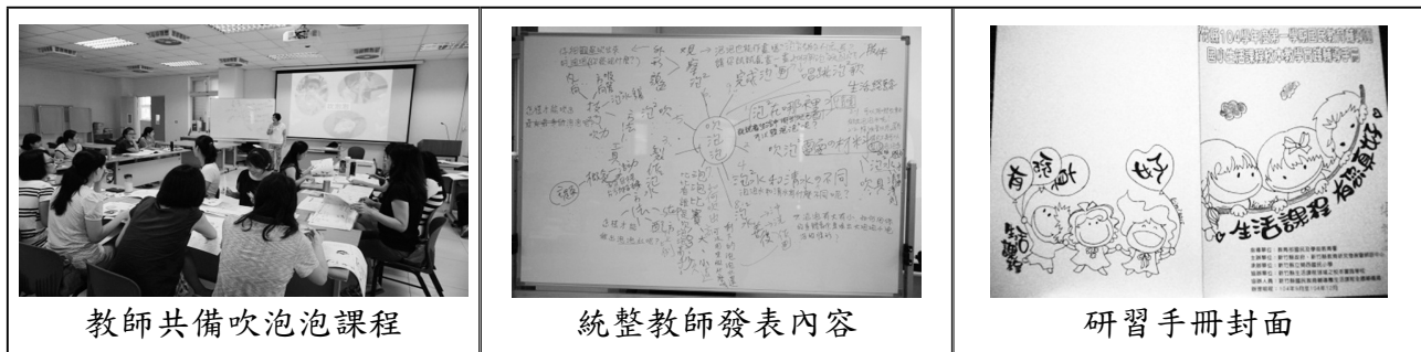
教師共備吹泡泡課程