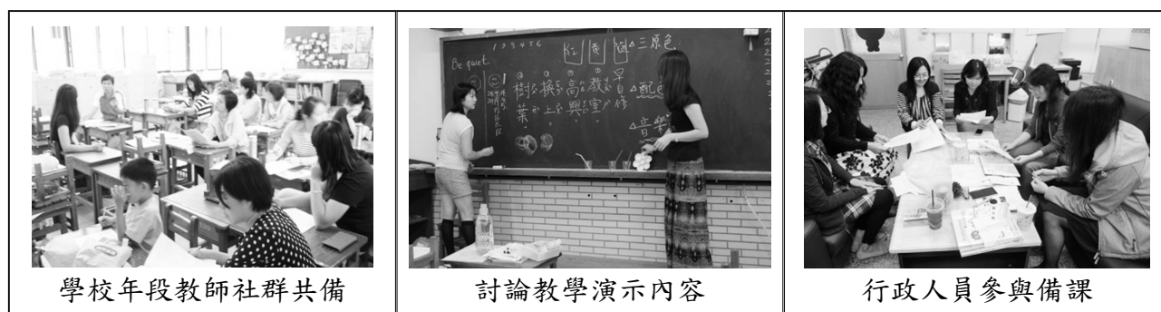
學校年段教師社群共備

議課時，教師關注焦點在學生的學習型態和發生學習的時機，平時是一位教師關注全班學生，在演示時增加為多位觀課教師關注個別學生，觀課教師發表對學生的細膩觀察和紀錄，提供導師思考和建議；藉由現場觀課教師的眼睛，觀察學生的學習模式和特性，提供導師做為教學參考；更由於角色的變換，觀課教師由教學者轉換為觀察者，在觀察演示教師教學後，反思自己的教學策略和課程脈絡，提供雙向的回饋和反思。