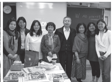
校長與教授訪視教師社群