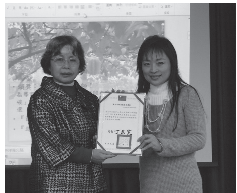
校長在月例會公開頒發團體績優獎項激勵士氣