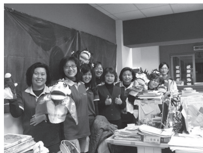
愛心家長偶劇演出