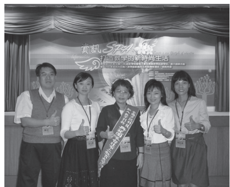
榮獲資訊融入創新教學典範團隊