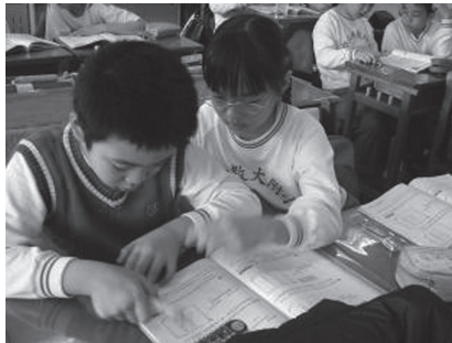
運用同儕的教導協助學習