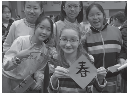
迎春揮毫送愛心活動