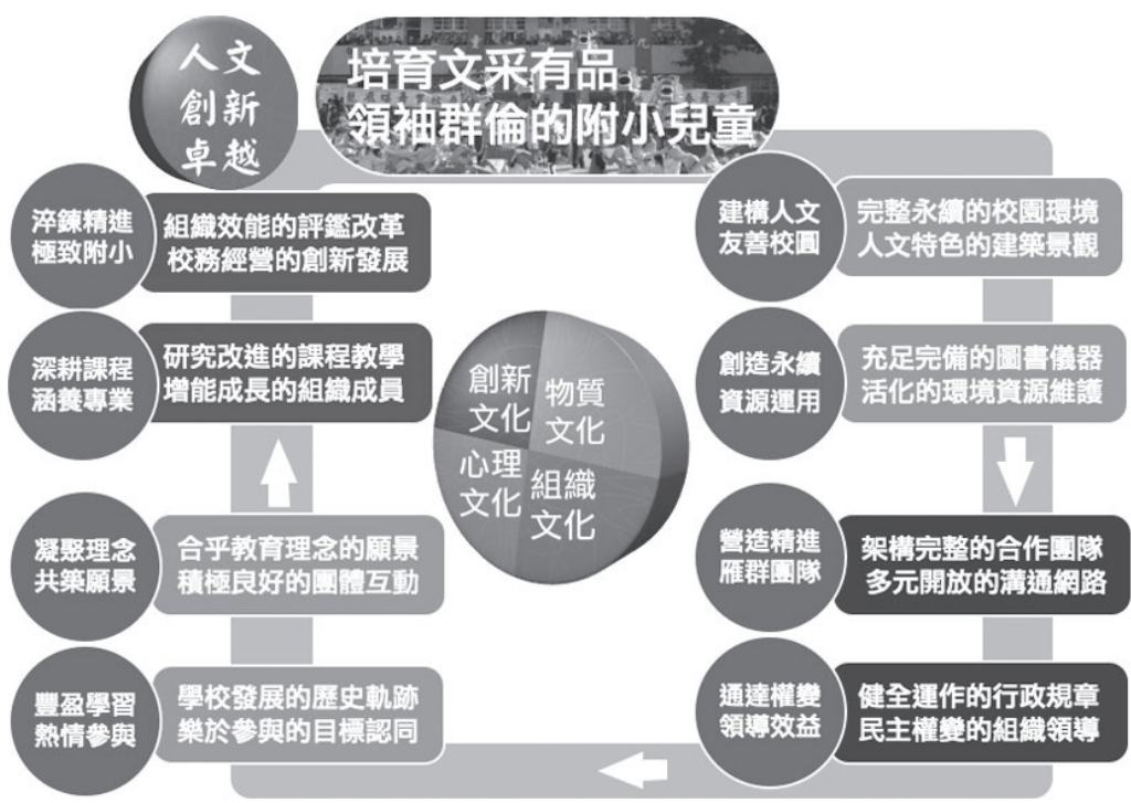
市教大附小學校文化具體目標行動藍圖