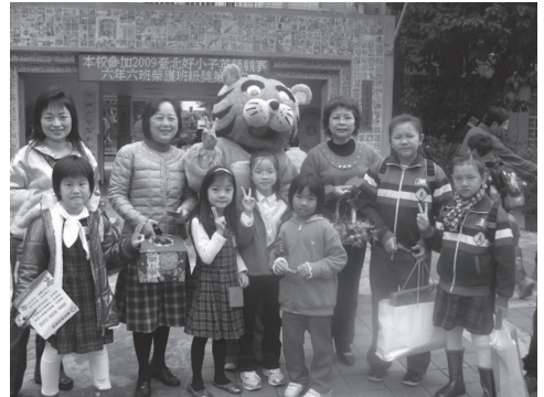
校長在校門口迎接學生上學