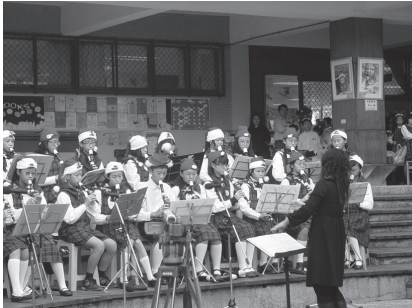
圖書館前表演之人文廣場