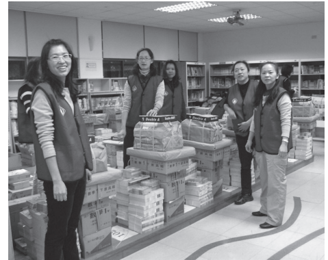
愛心家長協助開學發書事宜