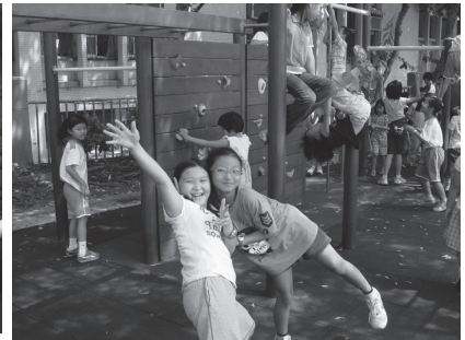
遊戲場可以盡情遊戲