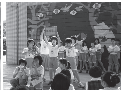
藝術季在升旗台後的小舞台演出