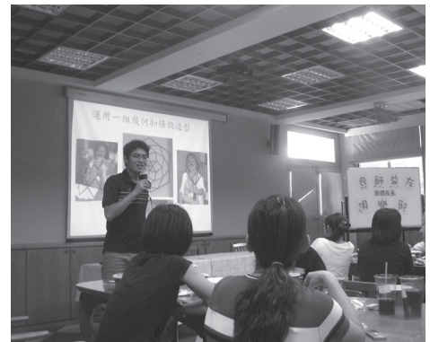
教學輔導教師之良師益友俱樂部