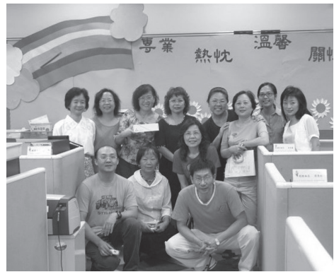
校長於開學前至各處室為同仁打氣