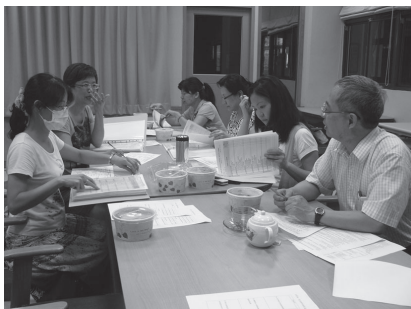
邀請教授蒞校指導教專推動