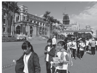
特色課程參觀總統府