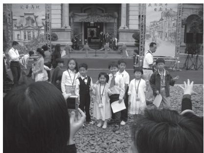
參加臺北賓館竣工典禮