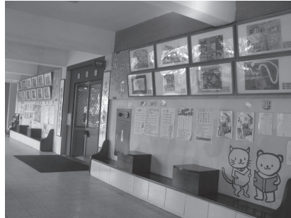
圖書館前藝術櫥窗