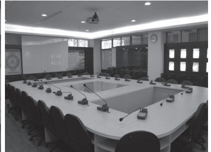
具課程功能之校史室