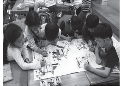
廣徵意見收集看法設計校園