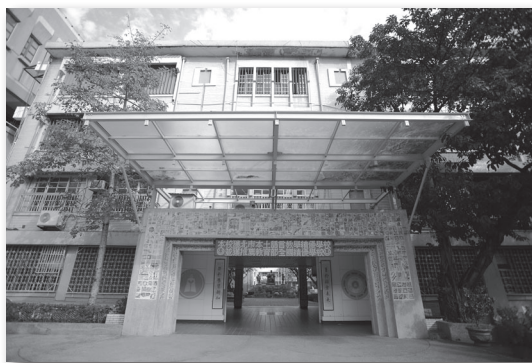
經美化的前校門區