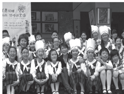
美青阿姨陪你遊書海