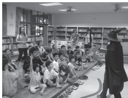
利用繪本區為特教學生演出偶劇