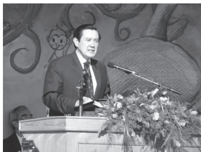
馬總統以校友身分參與校慶