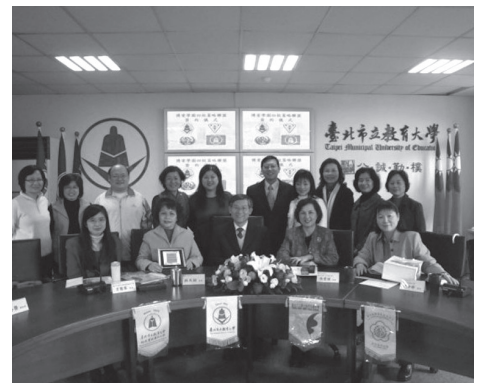
博愛學園四校聯盟