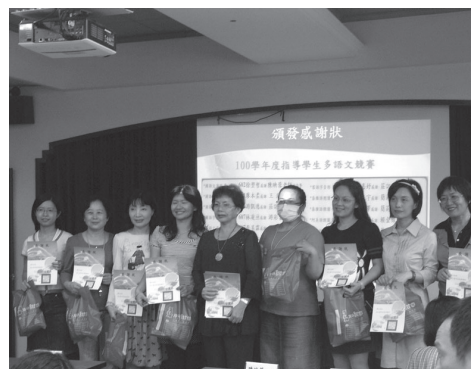
校長頒發多語文競賽指導老師感謝狀及禮物