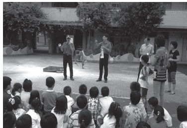
東湖消防隊到校協助辦理學生防災滅火體驗