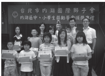
內湖國際獅子會頒贈本校 清寒學生獎助金