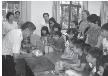
辦理家長親職教育認識中國傳統童玩畫糖