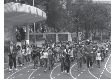
全校親師生參與潭美小超馬慢跑活動