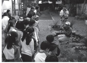
珍古德協會進行臺灣原生種植栽認識