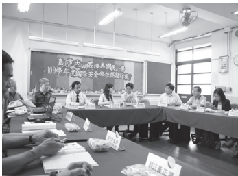
通過 2012 年國際安全學校認證