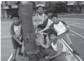
辦理校園安全小尖兵，發現安全死角