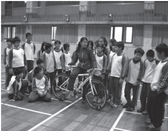
邀請青少年國手分享三鐵運動的甘苦

成就多元學習效益：落實教師課程教學，提供學生展演空間，並規劃參與校內外競賽，爭取優異表現，建立學生自信心，創發學生學習無限潛質。