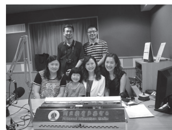
新生閱讀起步走 - 接受教育廣播電臺邀約錄音