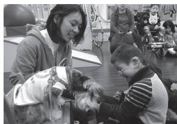
與狗醫生協會合辦提供 特教生輔育治療