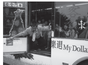
與東南客運合辦公車乘坐逃生演示教學