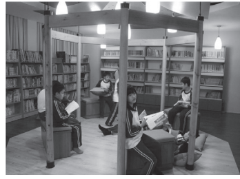
修建圖書館，提供柔和溫馨的閱讀空間