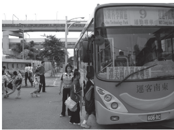
搭乘學生通學免費公車

共有普通班 18 班，自足式特教班 2 班，資源班 1 班，幼稚園 1 班。學生人數 347 人；教職員工計 56 人，教師獲碩博士學歷比例達 48.8%。