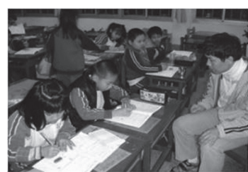
攜手班教師指導學生補 救教學提升學習成效