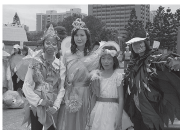
參加藝術嘉年華兒童節巧妝踩街活動