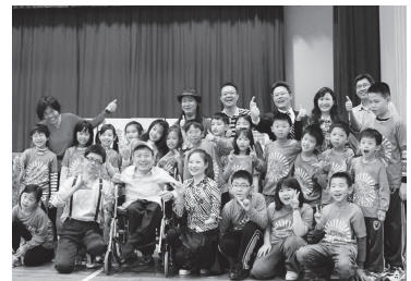
兒童節觀賞混障綜藝團擔綱精彩演出