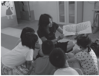
與毛毛蟲基金會合辦學生小團體輔導