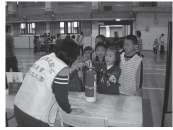
期末辦理全校師生健康促進闖關活動