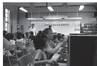
辦理假日親子資訊研習營