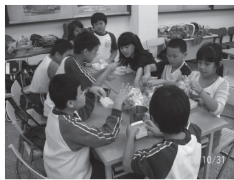
夜光天使點燈專案班實施 品德教育