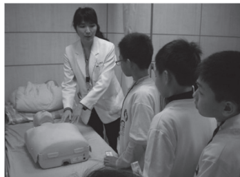
與三軍總醫院合辦小醫生、小護士夏令營