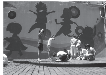
營建藝術人文意象牆，設置木質展演平台