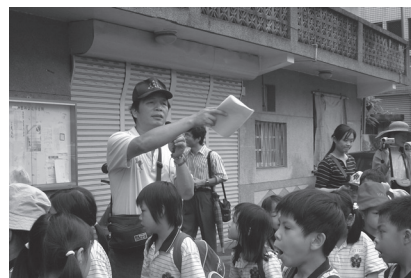
參與眷村保存紀錄與研究