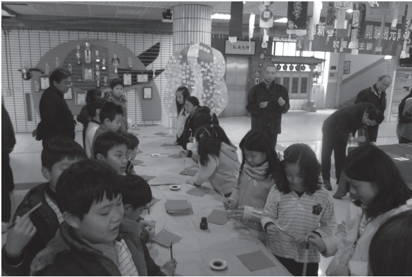
新春揮毫體驗活動