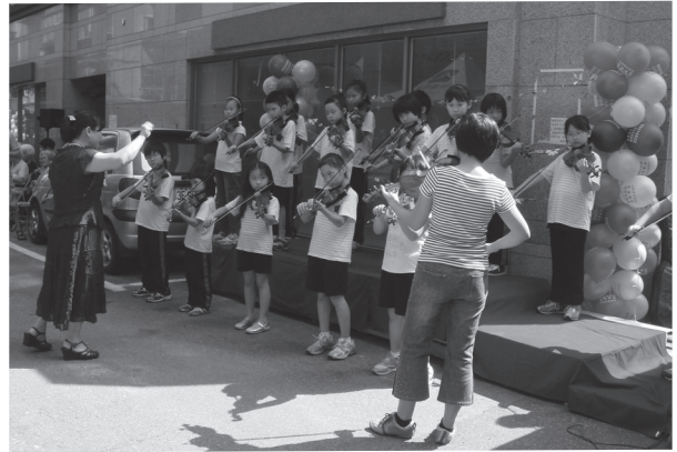
弦樂社團學生到社區參與表演活動

組織，藉由會議討論資源分配的順序性，適切的分配資源以促進學校多元發展，並讓弱勢學童獲得完善的照護與輔導。