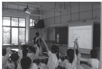
台大學生到校教導認識昆蟲