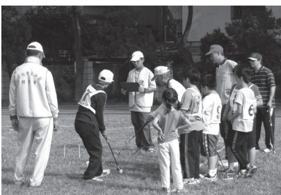
辦理社區槌球競賽

本校資源統整目標之發展，係以學校願景為核心，並對應學校經營目標逐漸發展形塑產生，依據校務經營展策略，積極整合與利用內外部資源，實踐學校願景執行方案，有效發揮資源效益，落實本校資源統整目標。為確實掌握社區、自然、人文環境，教師團隊透過實際踏查，將資源進