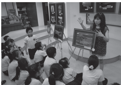
參觀圖書館攝影展活動

為落實學校人力、財力、物力與資訊，能公平分配到最適宜的需求，學校透過相關委員會與