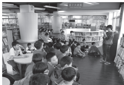
參訪景美圖書館活動