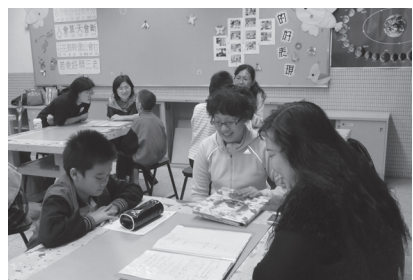
認輔志工家長輔導學生課業