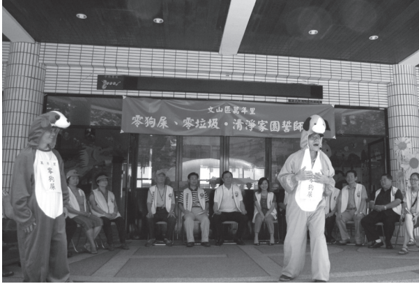
協助社區辦理零狗屎宣導活動