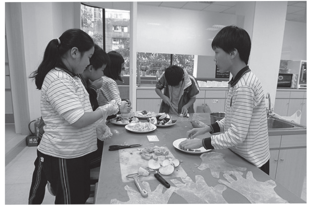
校本課程生活容易體驗