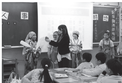
教師進行閱讀融入教學活動