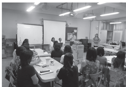
認輔志工家長培訓