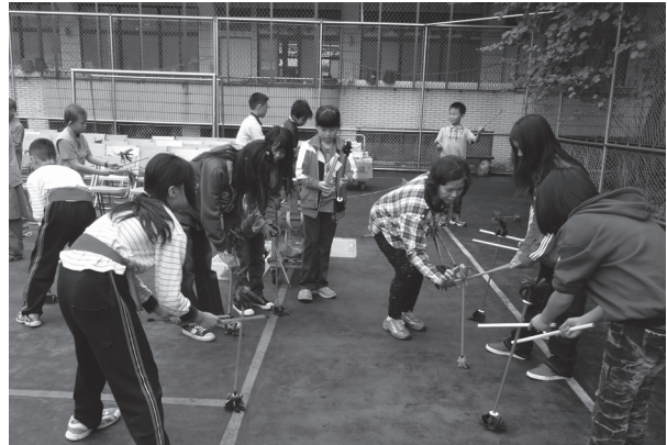
校際交流雜技體驗活動

析列表，分別就內部資源的優勢與劣勢，外部資源的機會與威脅，進行客觀的審視及剖析現況，以條列方式列舉相關內容，期掌握優勢利基、扭轉劣勢困境，將資源整合發揮最大效益，並依據學校願景與校務發展目標，透過團隊討論凝聚共識，轉化成為本校資源統整方案的具體目標。