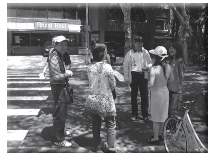
議員里長家長會會長與校長 會勘通學巷