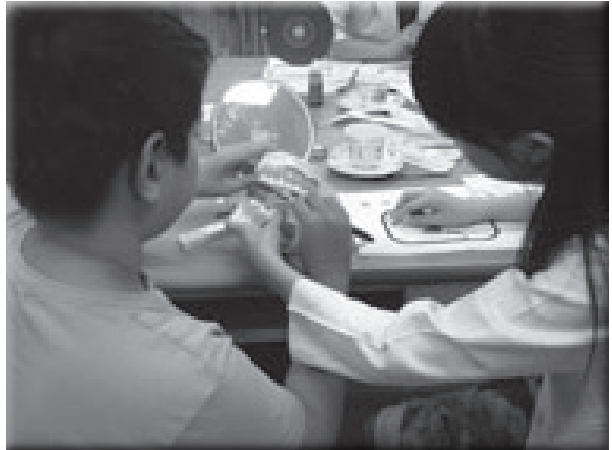
長庚牙醫師團隊個別指導特教學生正確刷牙

本校對於單親家庭、隔代教養、低收入戶、新住民子女、特教需求等弱勢學生特別照顧，以籌募學習基金、申請攜手班經費、愛心陪讀、仁愛基金、急難救助金、助學專戶等方式，讓每一位學子得以安心就學，成為民生最大特色。