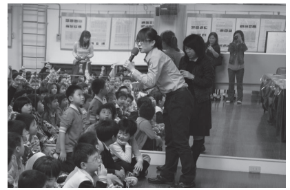
婦女警察隊蒞校宣導性侵害防治