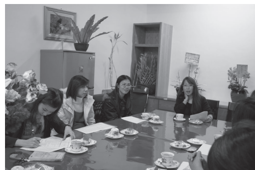
校長與學年老師下午茶