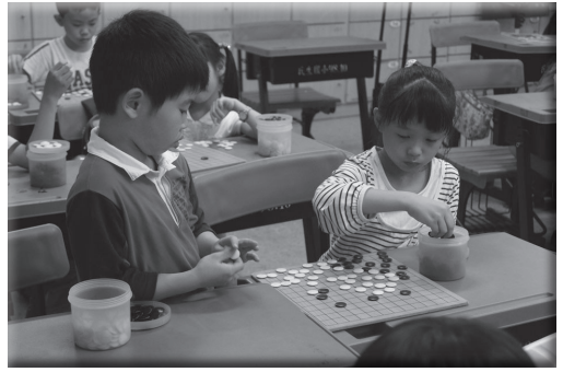
學生課後社團動動腦學圍棋