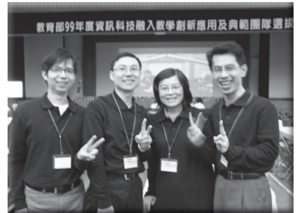
資訊科技融入教學創新典範團隊

本校教師認真專業發展成效卓著，榮獲 2008 年臺北市優質學校「專業發展」獎、2011 年臺北市優質學校「教師教學」獎，2012 年臺北市「教育 111 標竿學校」認證通過，以及 2012 年 GreaTeach-KDP 全國行政管理創新 KDP 國際認證優等獎。