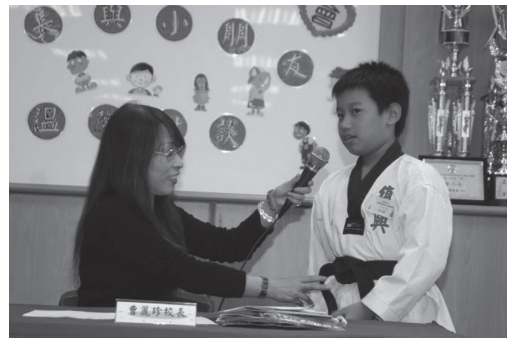
校長與小朋友午餐約會溫心對談

民生尊重每一個人價值，用心關懷、協助他人，營造友善校園環境。從校長與老師下午茶、校長與小朋友午餐約會、教職員工慶生會、文康活動、志工感恩活動以及志工家長大手牽小手各項服務等活動，關照特教需求學生適性學習和低收入家庭與學生。