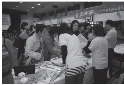
辦理升學博覽會提供家長充分資訊