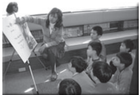
志工家長晨光說故事