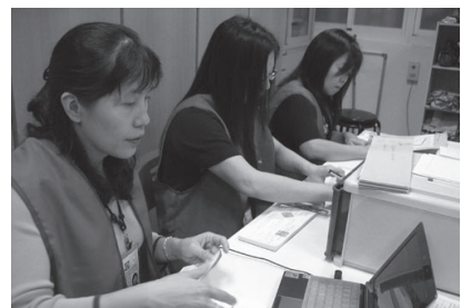
家長會進行全校小額募款

積極開發資源，辦理慈善表演募款，二手市場義賣、愛心專戶認養捐募等，濟助弱勢團體，每年家長會、志工團進行全校小額募款、募書，協助學校各項建設與學習活動，且參與志工團人數逐年大增，足見家長認同與支持學校。