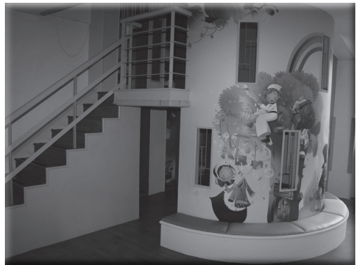
學習角故事城堡閱讀區完工

本校爲每個孩子的學習而努力，特別照顧單親家庭、隔代教養、低收入戶、新住民子女、特教學生等弱勢學生，無論是辦理「慈善演唱會」籌募學習基金、申請「攜手班」經費補助，透過愛心陪讀學習，或提供仁愛基金、急難救助金、助學專戶補助，均能讓學子得以安心就學，並建立互相關懷的良好校園氛圍。