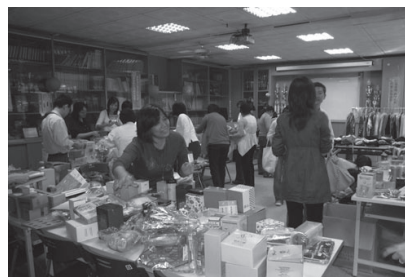
二手衣物義賣捐助弱勢