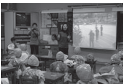
視訊直播觀賞操場體表會活動