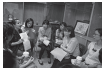
教師專業學習社群討論與分享