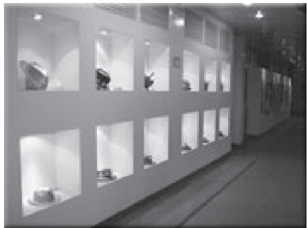
藝文情境布置提升校園文化