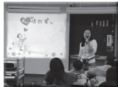
志工家長進行班級 EQ 課程