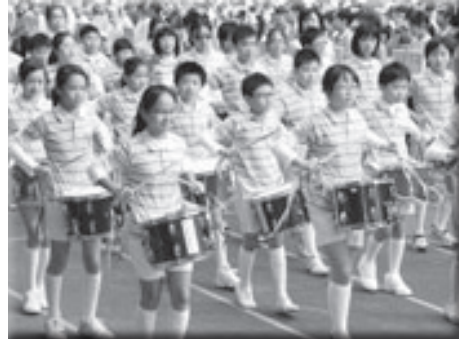
聲勢震天的鼓隊令人肅立

本校結合閱讀、E化為學校課程特色。建置知識管理中心，提供師生資源分享與服務平臺。榮獲 2010 年教育部「資訊科技融入教學暨創新應用績優學校」之殊榮。