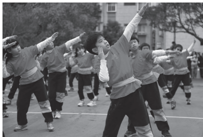
熱情洋溢體表會健康操表演