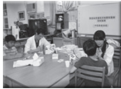
長庚牙醫師口腔衛教與追蹤

1. 能充分整合資訊，系統性發展特色，有效提供教學資源 規畫建置知識管理中心，提供教學與行政經驗與資源的分享平臺；建立各項資料庫與各類學習網頁，提供資訊服務與教育資源網路連結，便利教師專業分享創新知識，豐盈學生的學習內容，有效改善學習環境。資訊教育是學校校本課程，逐年