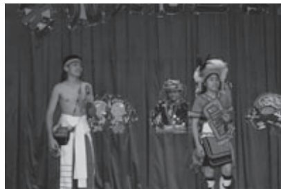
鄉土語言成果表演