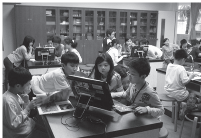
自然課運用群組電腦