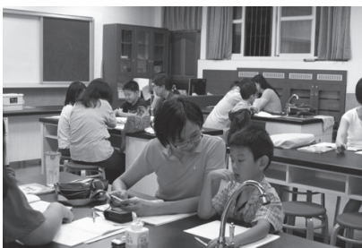
愛心志工家長陪伴學生學習