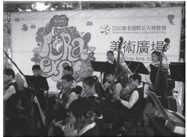
弦樂團學生參加花博展演