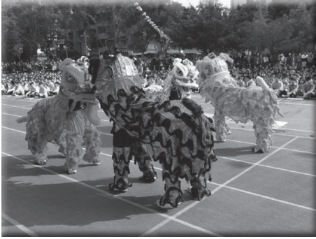
舞獅隊學生精彩表演獲滿堂彩