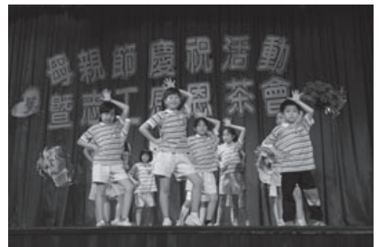
學生表演保庇舞表達感恩情