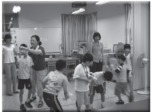
特教志工協助學生體適能活動