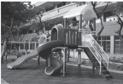
改善後採用無縫地墊