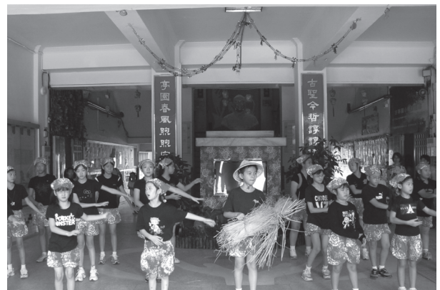
本土語言教學實作