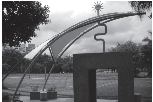
改善後 - 溜滑梯公共藝