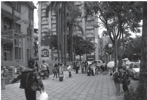
改善後幽靜古樸景象

方案規劃之初，古亭團隊希望在「穩定發展中求精進，進而在精進中求精緻」。亦即奠基於歷任校務經營的成果上，在穩定中為古亭校園增添新風貌，以達校園環境之「除舊創新，優質展欣」理想。整體學校校園風貌再造構想，係源自於身處教學現場的我們，以及家長對學校的期待，以對當前校園存在現象所進行分析。