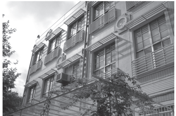
改善後彩繪賦予新生命