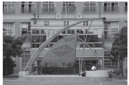
改善後藝術帆船造型