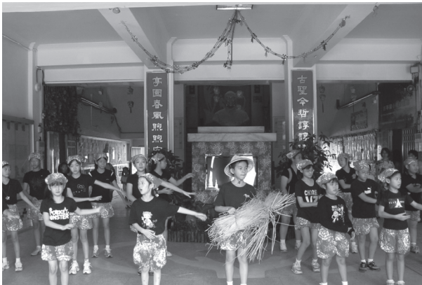
本土語言教學實作

在古亭國小裡「眾志成城」是營造優質校園成功的最佳寫照，每個人的意見都很重要，但更重要的是成員們討論的對話歷程。在討論的過程中，舉凡學校裡的同仁（例：校長、行政人員、教師等），還是家長會的代表，甚至是專家學者的意見，在會議中都予以合理的尊重，讓成員都