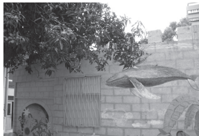
工具室外師生創作