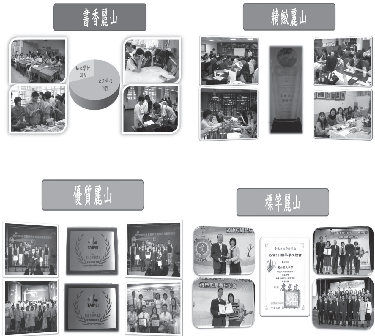
圖 3.「麗山學校品牌」—麗山國中優質學校「資源統整」方案創新成果圖

造麗山成爲一個「溫馨關懷的友善校園」，使全體親師生都能在這「教育服務」的校園氛圍裡，洋溢著「幸福感」與對學校的「認同感」，讓親師生天天都幸福快樂的享受生活。相信這應該是推展「行政管理」方案的最大效益，也因此使得麗山全體親師生能浸潤在這份幸福、快樂與被服務的氛圍裡，攜手打造麗山品牌，提升整體學校效能，達成學校願景目標。茲就下圖 3.「麗山學校品牌」來闡述推展本方案的創新成果。