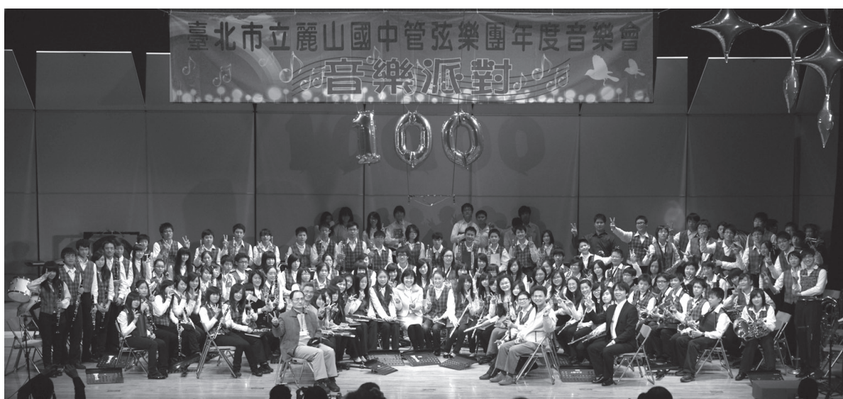
管弦樂團音樂派對 - 親子廣場