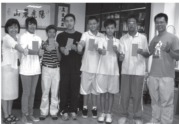
高爾夫全國賽誓師