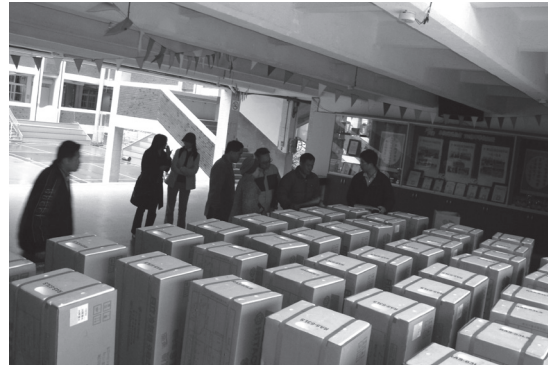
班級教室冷氣室內機安裝