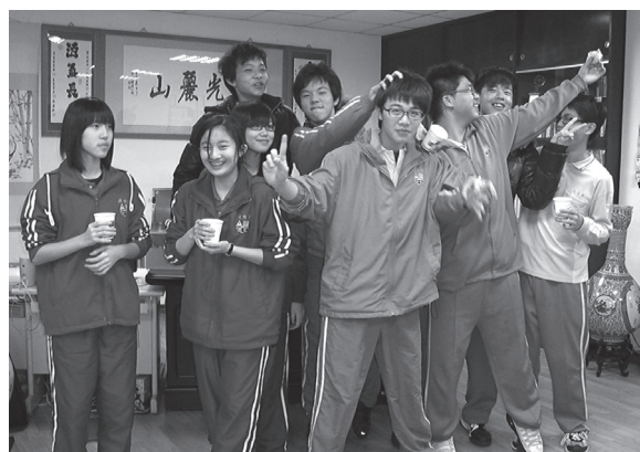
九年級學生夜自習校長室敘會