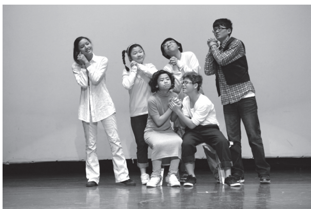
父母心祖孫情全國戲劇比賽

未來，我們期許在優質的行政管理上，持續精進發展，有計畫的推動與成果評估，期能建立一套學校人力、物力資源常設性標準化作業系統，讓師生在教育資源的取得中，有跡可循；也提供師生教學活動中，更豐碩的教學資源，彰顯學生學習成果。