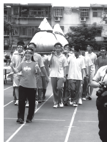
包中祝福與感恩迎金粽