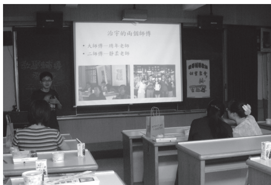
教學輔導教師卒業式