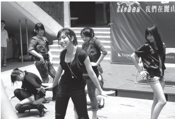
新舞臺 9 年級告別演出