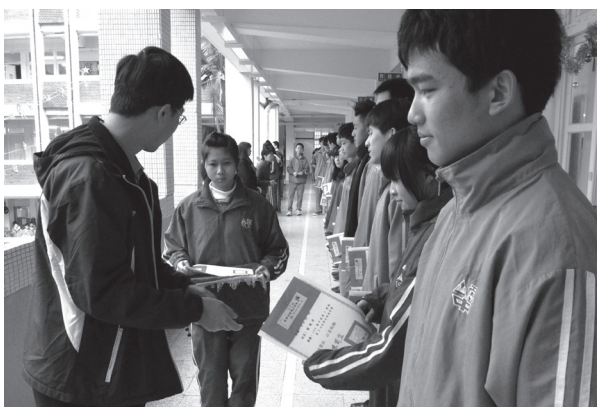
朝會時家長會代表頒發獎勵金