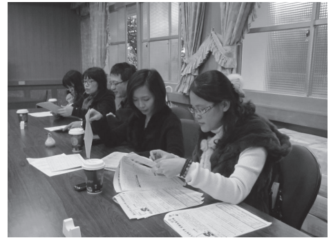
國文教師社群活動