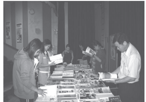
教師教學檔案觀摩