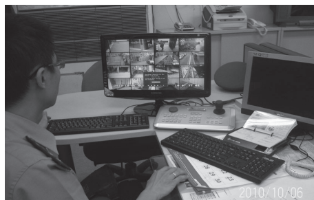
安全校園環境教官 24 小時監控