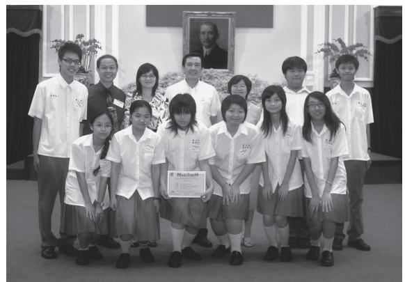
榮獲 2008 臺灣學校網界博覽會設計大賽金獎師生赴總統府接受表揚