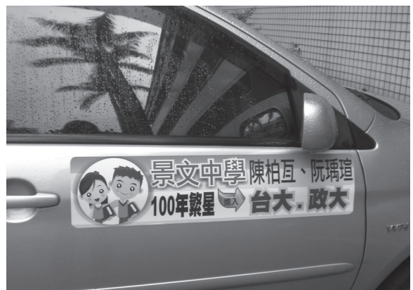
校長及老師座車是最佳流動招生廣告