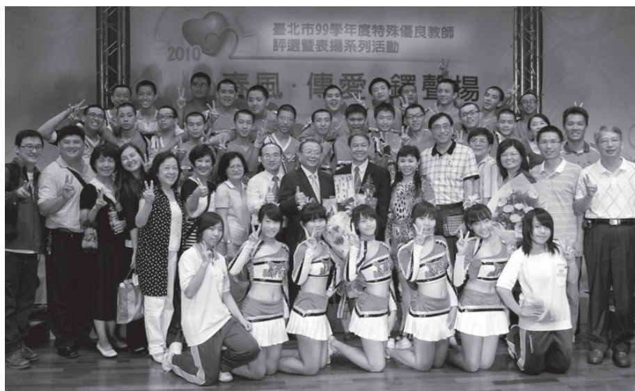
校長榮獲特殊優良教師校長類