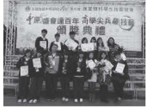
商業類技能競賽成績亮麗

H. 武術菁英培訓獲「臺北武術節全球華人傳統武術交流大賽」男子組其他拳術組金獎、「世界運動會運動公園活動 -- 太極拳表演賽」推手男子組第 1 名、「臺北市教育杯中小學武術錦標賽」高中組武術總錦標第 1 名。