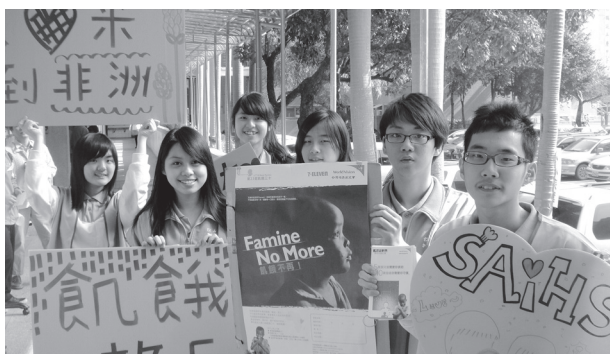
飢餓 30 體驗活動

本校附近設有臺北醫學大學 1 所。高職 2 所，高中 3 所，國中 4 所、國小 9 所，合計 20 所，學區環境多屬青壯人口結構，教育程度甚高，深具發展潛力之地區。