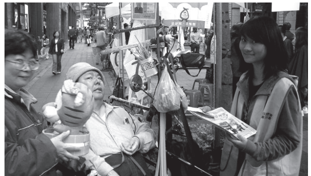
服務學習公益活動