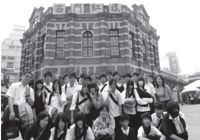
臺北行腳_西門紅樓