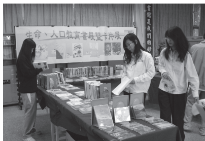
生命教育書展暨版畫展