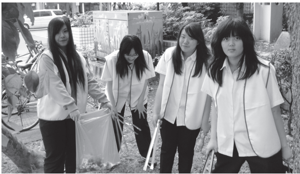
環保志工社區清潔