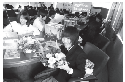
國際交流花藝教學