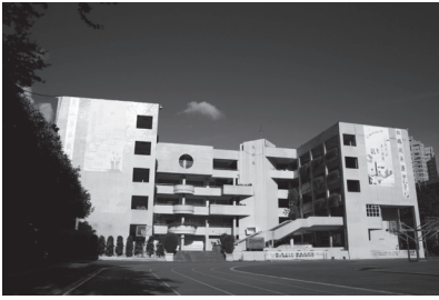
校園 _ 成功樓