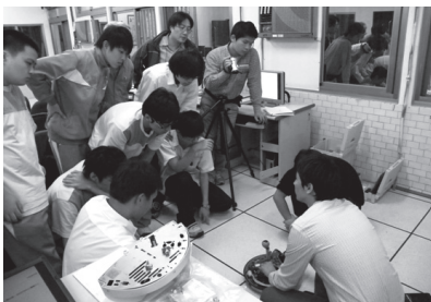
全神貫注專業學習