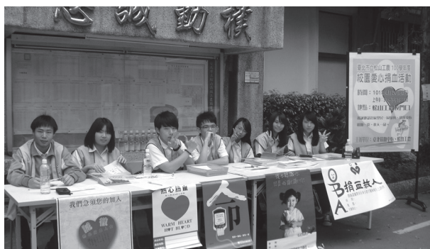
捐血一袋救人一命