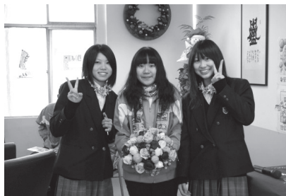
國際交流花藝教學