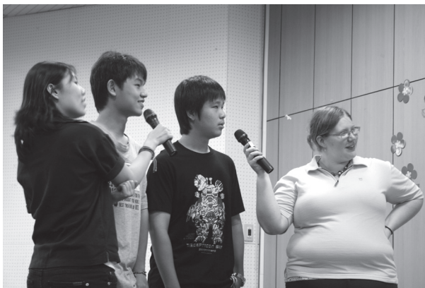
多元學習生活美語研習

推展學生學習各項措施與活動，能均衡發展，各項活動著重於全面學習，不偏廢。活動執行不靠各處室单打獨鬥，而能橫向聯繫協調，跨處室辦理，不造成爲活動而活動，並能收多元活動、多元成果之效。