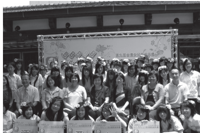
臺灣女兒成年禮活動