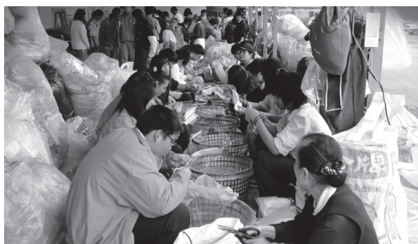
環保志工愛物惜物