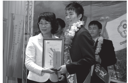
倫敦國際技能競賽 _ 花藝銀牌