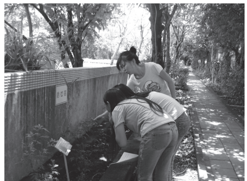
共同整理校園生態環境服務學習

大佳國小鄰近大佳河濱公園旁的絕佳地理環境，讓學生得以在軟硬體設備豐富的生態景觀中適性發展，面對少子化及開放學區的雙重壓力，教職員工激發出建立