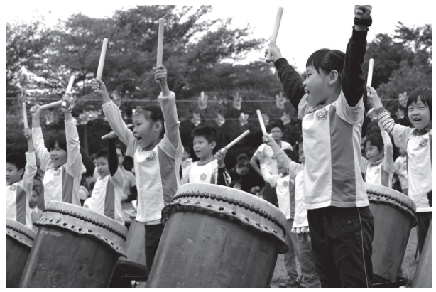
課後打鼓學藝活動演出