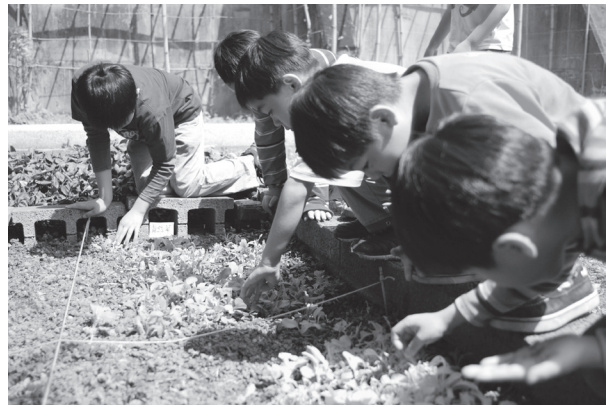
開心農場有機栽植