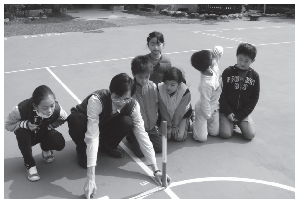
日影觀測教學活動