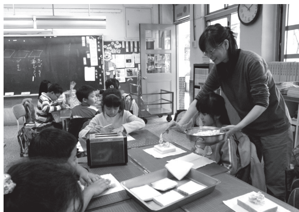
綜合課動手做教學