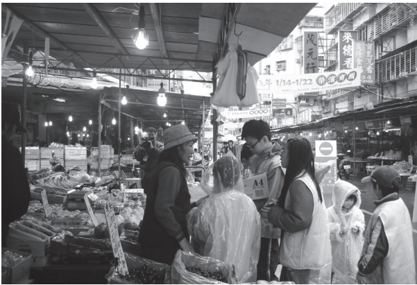
自製精油濱江市場義賣