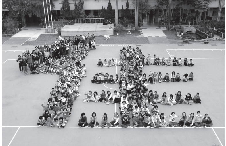
大「佳」冬至及國際交流活動

民國 80 年 8 月因基隆河截彎取直工程施工，行水區內居民銳減，本校學生因而大量流失，83 年最少曾達全校僅有 47 名學生。在全校同仁護校心切，不辭辛勞，披星戴月，犧牲奉獻的精神及共同經營學校理念驅動下，除主動為學校宣傳外，並結合社區家長資源，共同推動學校特色。以專車接送學生，並爭取為開放學區，鼓勵設籍臺北市的學童前來就學，因而深獲家長的肯定與讚同，自 84 學年度起，學生人數已逐漸增加，成為目前臺北市鬧區中難得的小班小校。