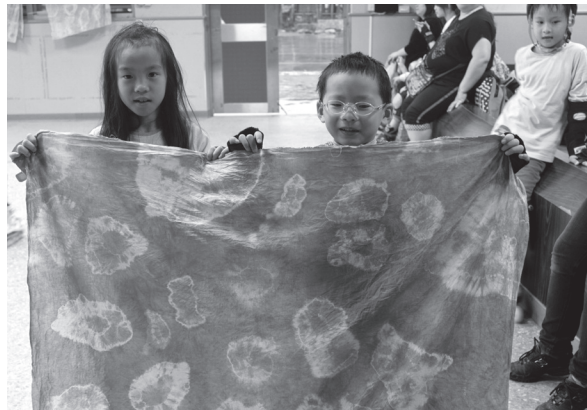
假日學校親子共學