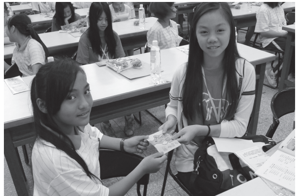
校際交流交換卡片