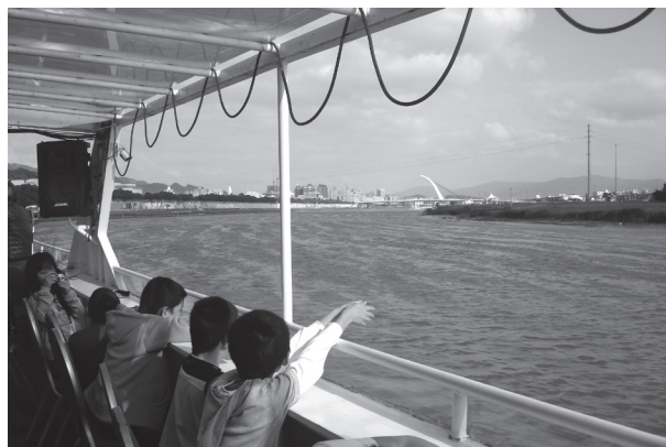
基隆河藍色公路生態體驗