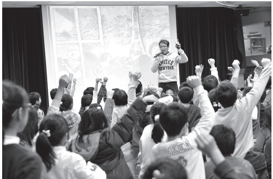
藝術到校專題講座

等工程，從校門改造為出發點，規劃多元教學園區，更新學校軟硬體設施、充實教學設備、構築綠美化環境、改造創意空間，為優美的校園增添了藝術人文氣息，營造多元學習空間，在紮實的硬體基礎上推動生態教育、發展特色課程、深耕永續校園、傳承藝術人文、延續創意體驗、開發學生潛能，創造都市中的桃花源小學。