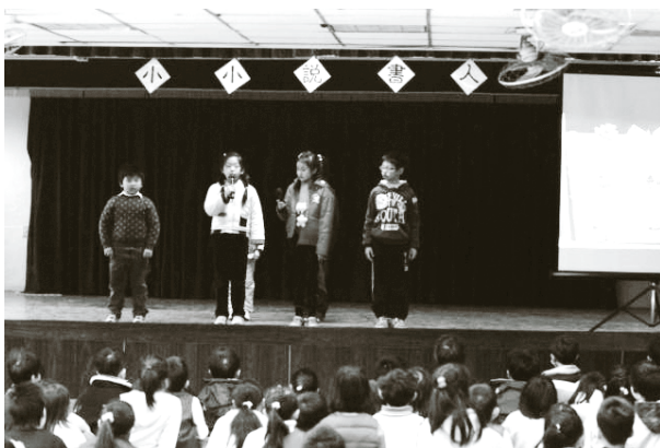
大佳綠色生活地圖分享