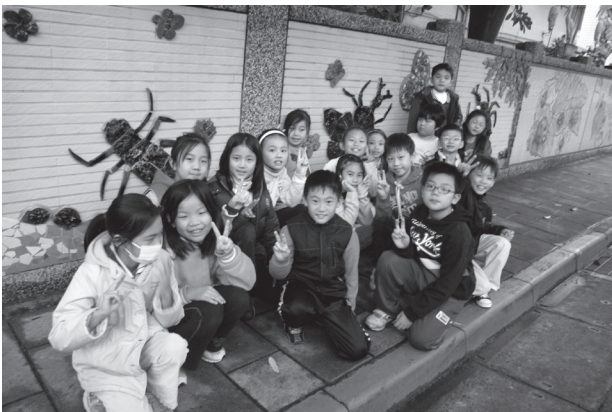
「樂陶陶」昆蟲陶版藝術牆

本校位於基隆河堤與中山高速公路間，鄰近大佳河濱公園，屬一單純、獨立的小型社會。校