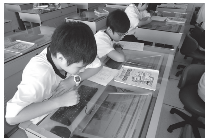
嵌入式個人化電腦教室