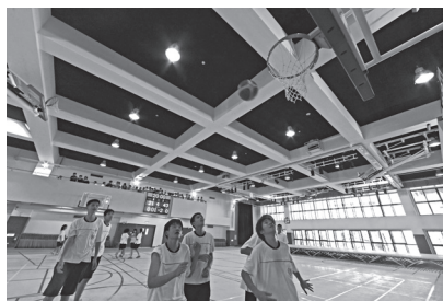
國際水準室內籃球館