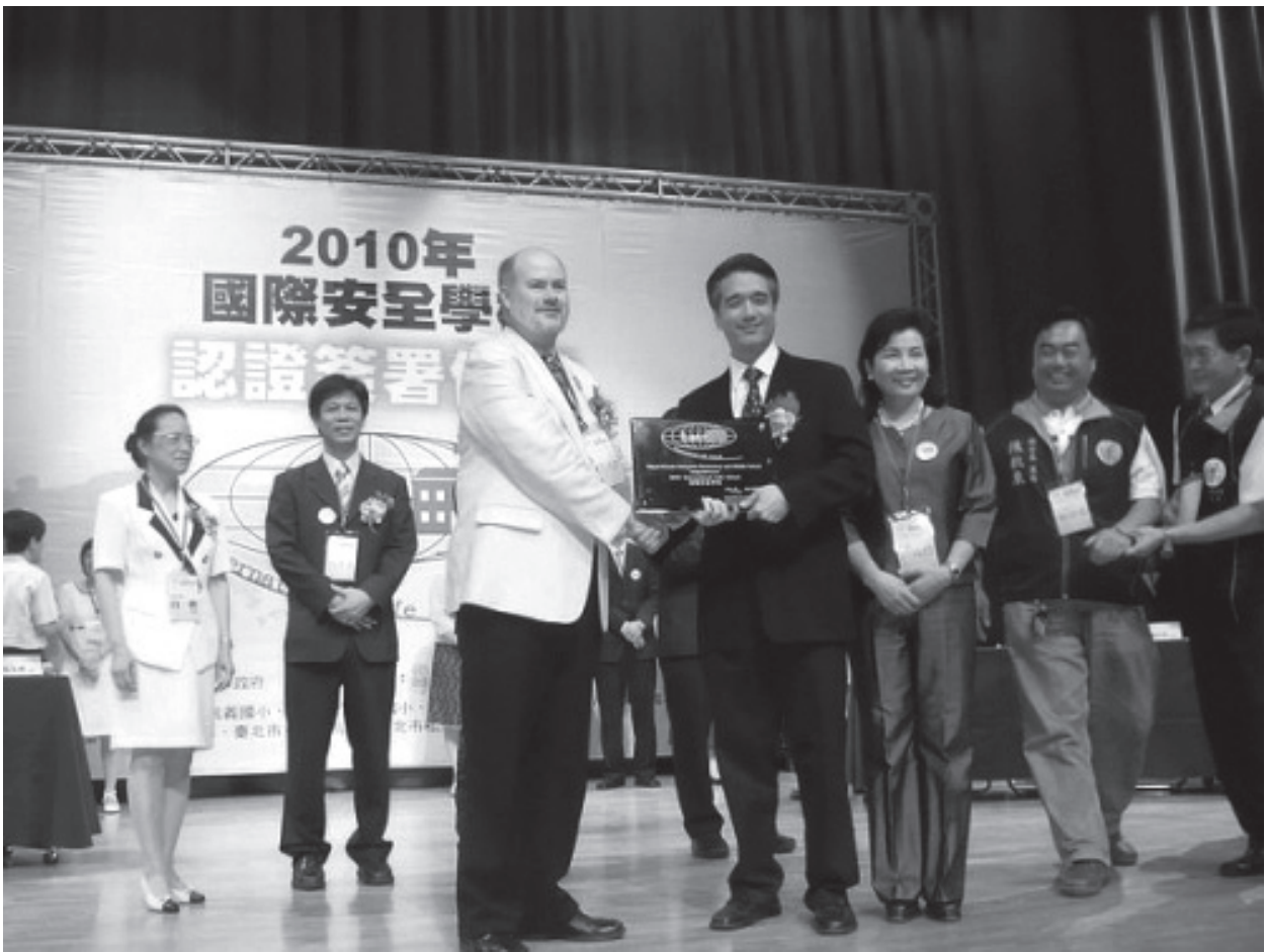
國際安全學校認證