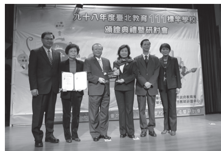
教育 111 認證