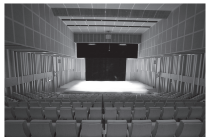
國家音樂廳等級演藝廳