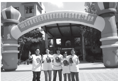
教學卓越獎方案發表

1. 國內交流部分：藉由班級教學觀摩、或個別學生才藝交流、家庭接待及團康活動等，拓展學生視野。 2. 在國際交流的部分，推動學校國際化，與國外中、小學締結姊妹校，並與大陸、香港、新加坡、日本、蒙古、英國等學校，建立交流學習機會。95 年度至今『每年辦理』海外地區遊學活動，積極爭取本校參與國際性青少年活動。 3. 近幾年來，靜心師生出訪計有：2006 香港蔡繼有中小學、2008 新加坡南華中學、2009 北京樹人瑞貝國際學校、2010 日本長野縣茅野市北部中學校、澳洲昆士蘭省 Rachedale South State School 暨 The Gap State School 等。