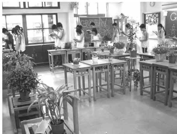
▲ Green Longmen 課程