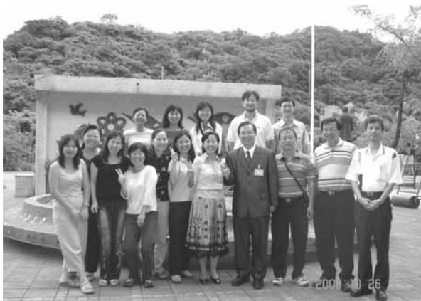
▲ 家長會正向參與學校教育