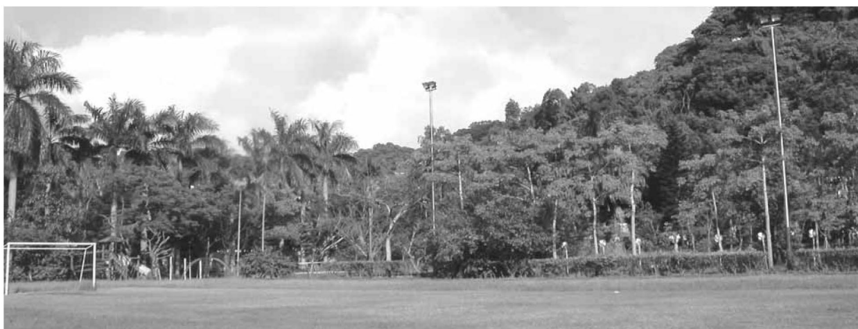
▲ 七彩校園綠意盎然

在劣勢因素中：少子化之社會現象衝擊小校之存廢，本校學區內周邊是文教機關，是大安區少有的人口較為稀疏的地帶，就學人口成長不易，僅能勉強維持目前之班級數。再者家長素質兩極化，學生學前學習已有雙峰現象，考驗教師教學效能，而且雙薪家庭多，家長志工參與不易。