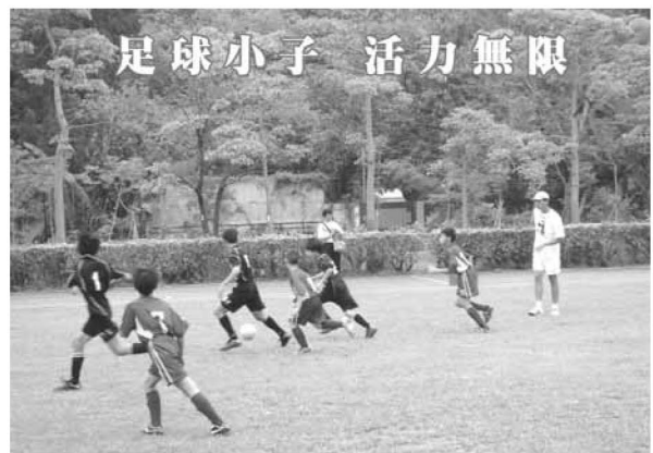
▲ 足球小子活力無限

對公館的孩子，我們不僅要栽培天地一沙鷗的明星，更培養雁群合作的精神；諸如學生體育活動、足球、田徑、游泳、童軍、創意競賽、繪本創作、駐校藝術師、書法教學、科學創作等，均證明孩子的表現不僅突出，而且未來的發展不可限量，目前在體育在臺北市的比賽中皆屢獲佳績。