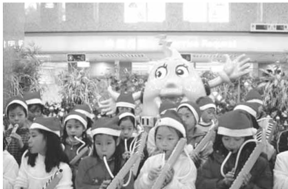
▲ 耶誕天使社區傳送佳音