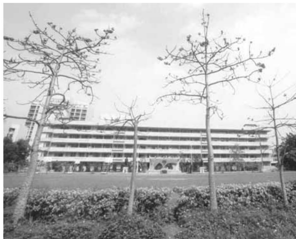
▲ 創意巧思 活力校園