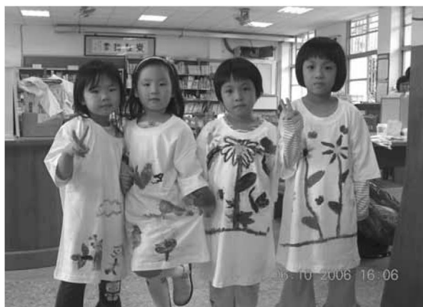
▲ 樹葉拓印將藝術穿在身上