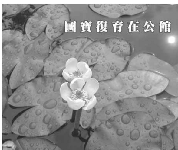
▲ 臺灣萍蓬草目前生長良好

* 「教育即旅遊 (Education as travel)」，我們以「蟾蜍山下的綠廊、都會中的綠洲、城市喧囂中的森林小學」的優勢條件，發展「生態特色遊學」活動。