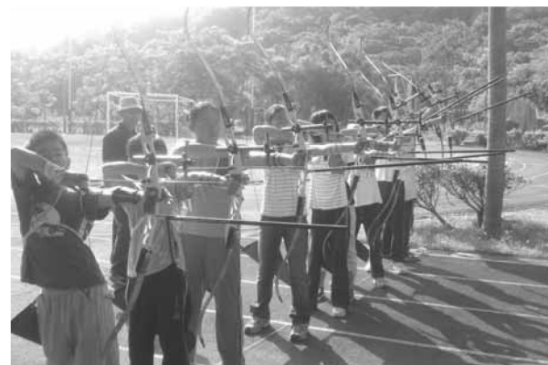
▲ 成立射箭隊培育奧運種子選手