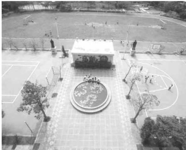
▲ 木棉參天 校舍巍峨