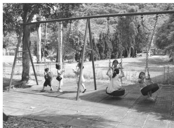
▲ 用心維護安全的遊戲場，迴盪許多快樂回憶