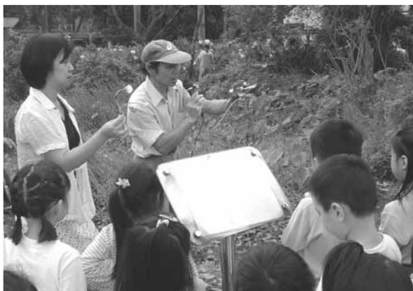
▲ 運用退休師長資源，培育小小生態員