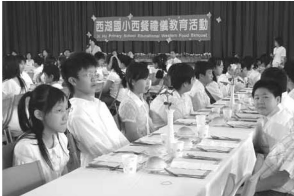
▲ 西餐禮儀教育活動