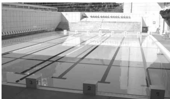
▲ 游泳池池體塗面更新