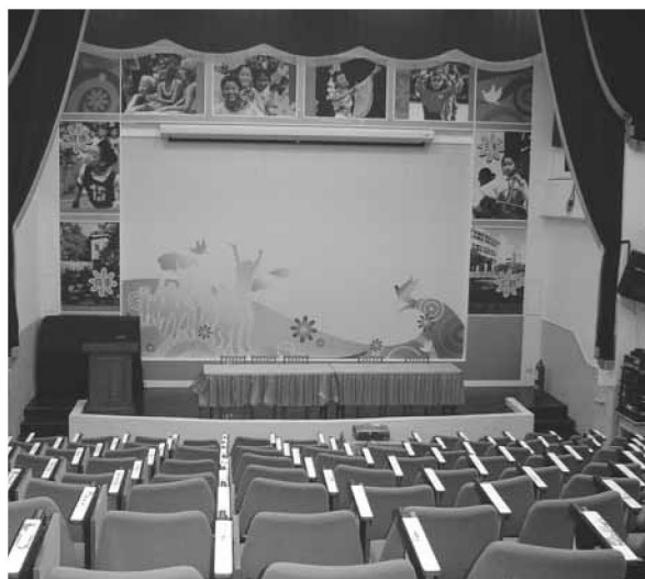
▲ 視聽教室 舞台燈箱