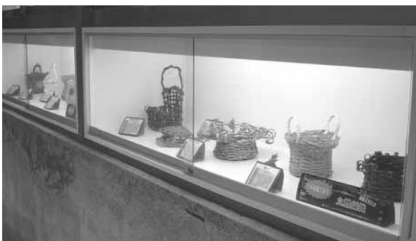
▲ 藝文廊道—美勞作品展示櫥