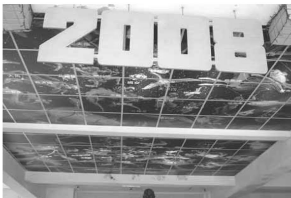
▲ 川堂星空天花板燈箱