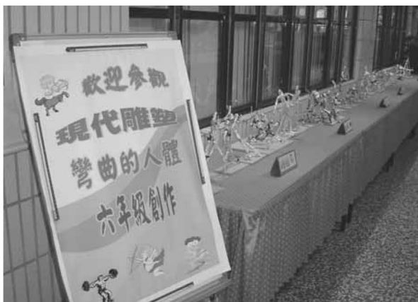
▲ 學生美勞作品展示區