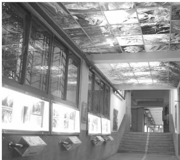
▲ 生態教育廊道燈箱