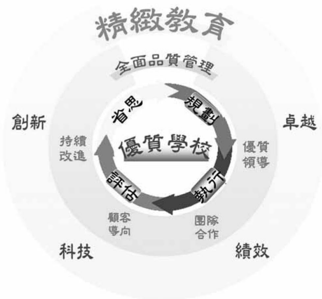
圖1 評選標準概念圖

本評選標準依據精緻教育理念，參照全面品質管理的精神，採方案規畫、執行過程、成果評估、省思分享的循環模式，兼具重視過程及結果之績效評選過程，期能提升學校經營品質，帶動學校持續精進。如圖1所示：